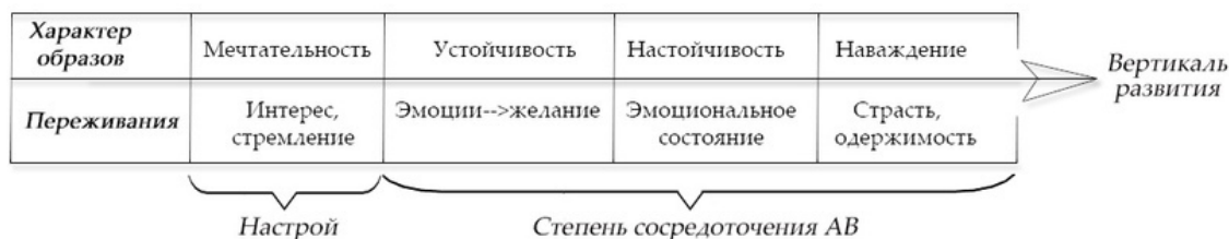
Рис 1. Вертикаль роста внимания бессознательного (автоматического внимания)

Внимание бессознательного – это его направленность и сосредоточение. Направленность – это внутренний настрой , развитие настроя и вызывает концентрацию бессознательного. Проявляется она в состояниях и соответствующих образах – от мечтательности до наваждения.