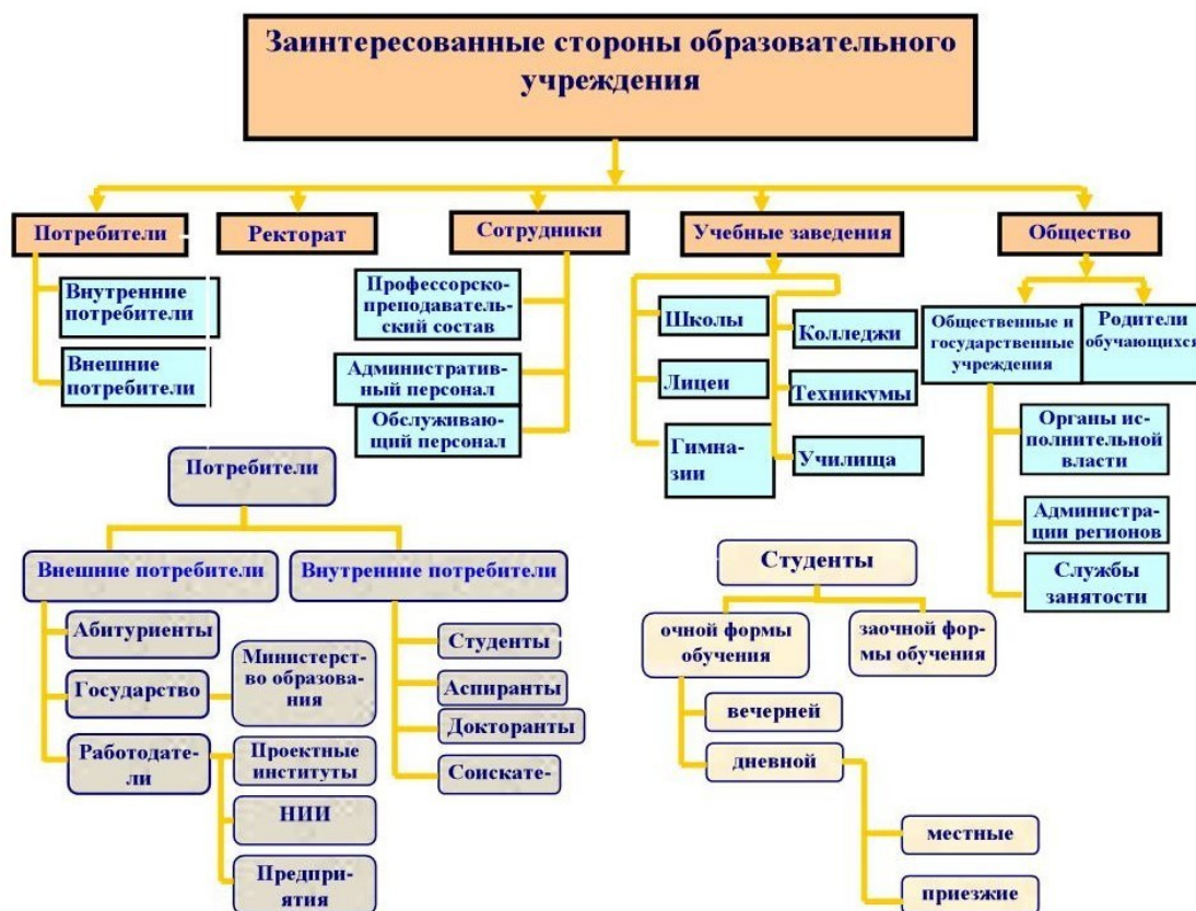
Рис. 3. Группы заинтересованных сторон образовательного учреждения

Она лояльна к свободному выбору личности и, главное, многоуровневая структура обеспечивает максимальную осознанность выбора специальности. А это увеличивает эффективность высшего образования и уменьшает возможность, как материальных потерь, так и разочарований выпускников вуза.