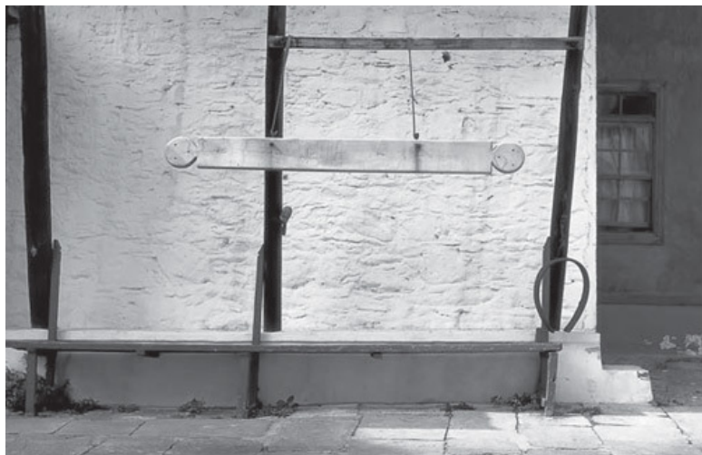
Деревянное и железное било