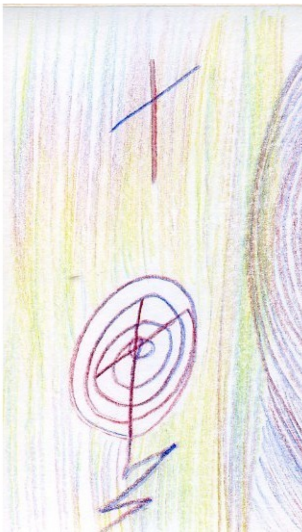
2 Чужая воля.