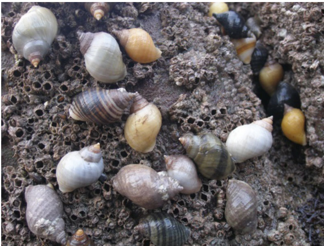
Рисунок 6. Разнообразие окраски раковин Nucella lapillus в пределах одного и того же местообитания. 7

Значит, естественный отбор под хищническим давлением птиц отбирает бабочкам окраску, соответствующую фону, всего за 50 лет (березовым пяденицам). Но этот же естественный отбор , под тем же хищническим давлением птиц, не отбирает окраску, соответствующую природному фону, улиткам. Что и говорить, естественный отбор – весьма неисповедимый товарищ.