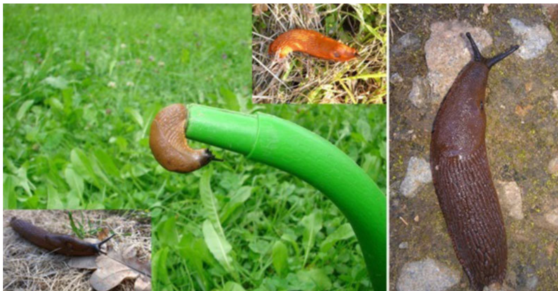
Рисунок 7. Разные представители обширной группы слизней – брюхоногих моллюсков, которые либо совсем не имеют раковины, либо имеют очень маленькую «раковинку». 8

Пусть дарвинист попредставляет себе (используя своё богатое эволюционное воображение), почему в то время как морские улитки столь серьезно озабочены хищническим давлением, что изменяют себе форму и толщину раковины, стоит только хищным крабам объявиться в окрестностях... в это же самое время слизень ничем не обеспокоен, спокойно ползает себе по лесу, не имея почти никакой защиты (кроме собственной слизи), несмотря на то что им охотно питаются: хищные жуки, ежи, кроты, землеройки, некоторые грызуны, лисицы, барсуки, грачи, галки, куропатки, дрозды, скворцы, дикие утки, чайки, лягушки, жабы, саламандры, ящерицы, змеи и другие животные.