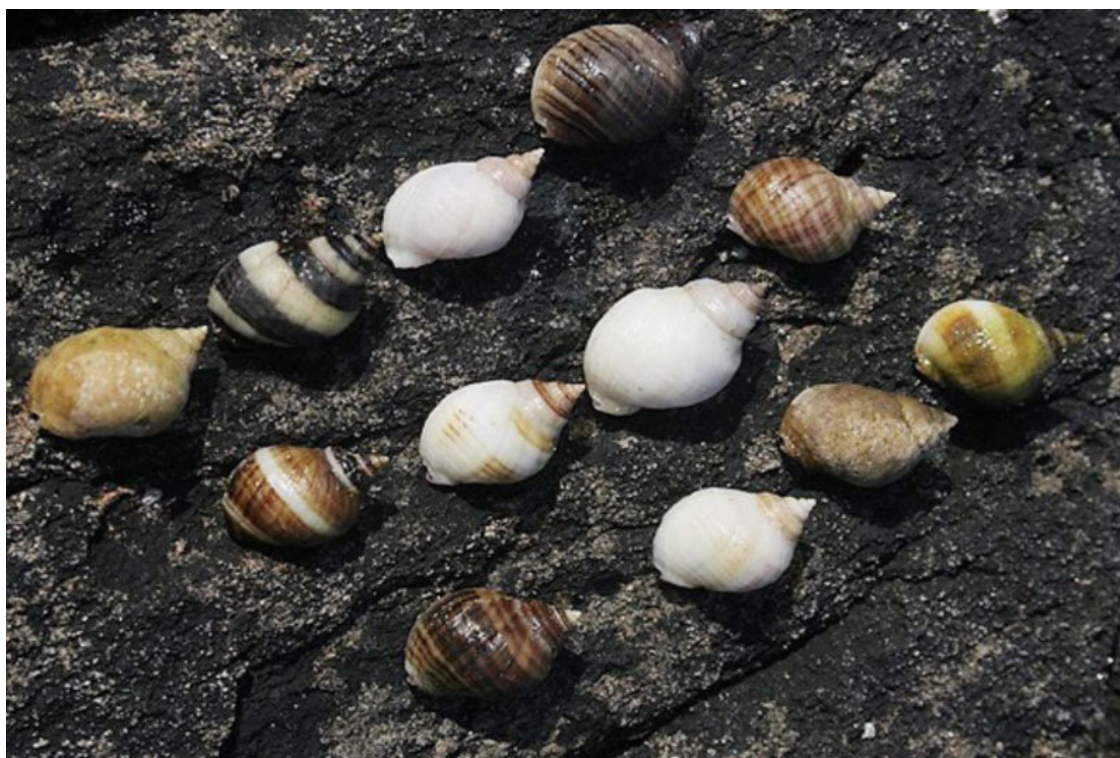
Рисунок 5. Внутривидовая изменчивость раковин Nucella lapillus по окраске. 6

Наконец, стоит посмотреть еще и на окраску раковин этого вида (Рис. 5):