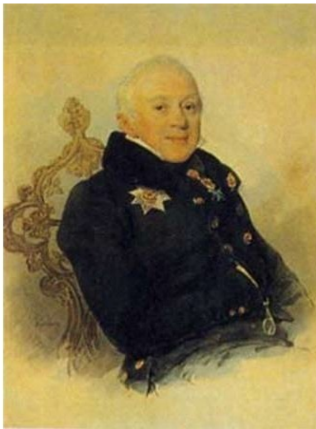
Алексей Никитич Пешуров, автор Соколов Пётр Фёдорович.

До 1803 г. служил в лейб-гвардии Семеновском полку. Отставной штабс-капитан. В 1823—1828 гг. он был Опочецким уездным предводителем дворянства, а в 1827—1829 гг. – Псковским губернским предводителем дворянства. В 1829—1830 гг. – губернатор Витебской губернии.