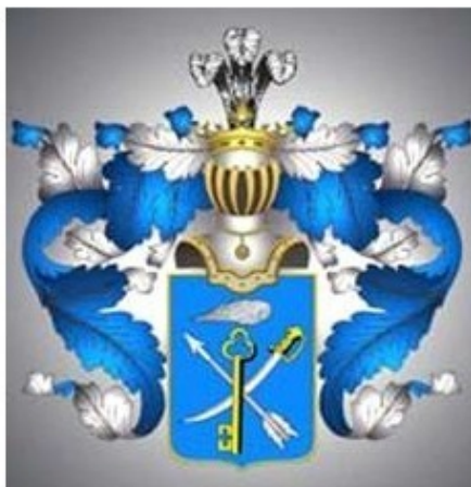
Герб Рода Пещуровых.

Род Пещуровых всегда был тесно связан с царствующим родом Романовых. Пещуровы на протяжении нескольких веков были ближайшими соратниками и родственниками Романовых. Алексей Никитич Пещуров (1779—1849), с 1830 по 1839 гг. был псковским губернатором. Внесён в VI часть родословной книги псковского дворянства с 1819 г. Алексей Петрович Пещуров (1795—1833) – обер-прокурор VII департамента сената, Мосальский (Калужская губерния) уездный предводитель дворянства, действ. ст. сов. Пещуров, Алексей Алексеевич (1834—1891) – российский флотоводец, мореплаватель, государственный деятель, адмирал. У рода есть свой Герб.