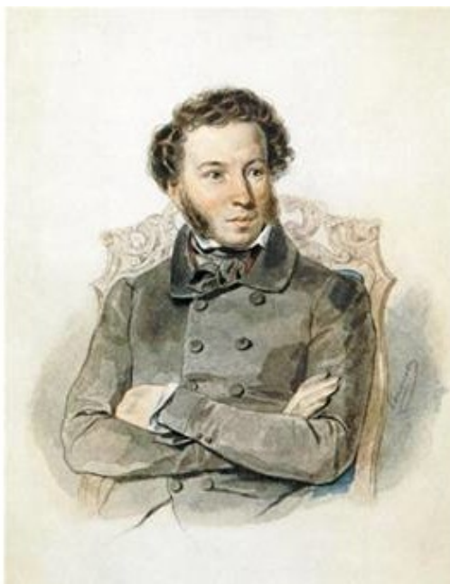
Портрет А. С. Пушкина, 1836 г.