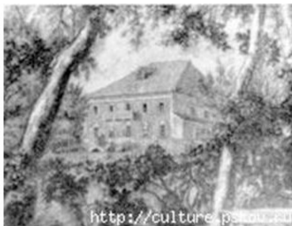
Усадьба Пещурова А. Н., Красногородский район, д. Лямоны.

Усадьба в д. Лямоны сохранилась. Туда возят туристов по Пушкинским местам. Большевики имение конфисковали, демократы прихватизировали. Интересно: кто будет возвращать?