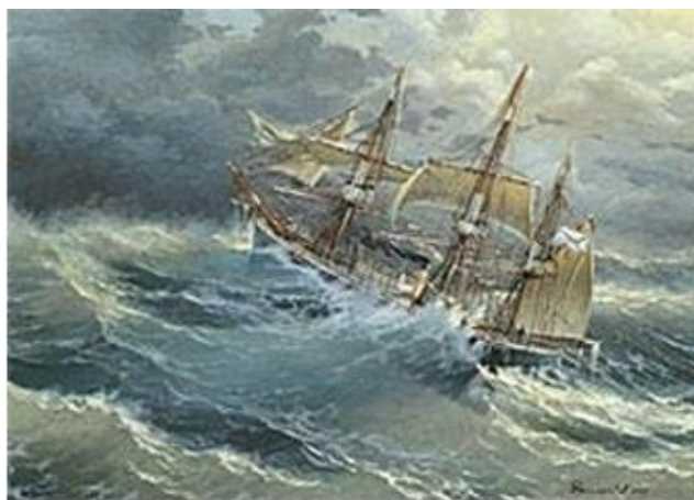
Гайдамак в океане. Орг., масло, 2008 г.