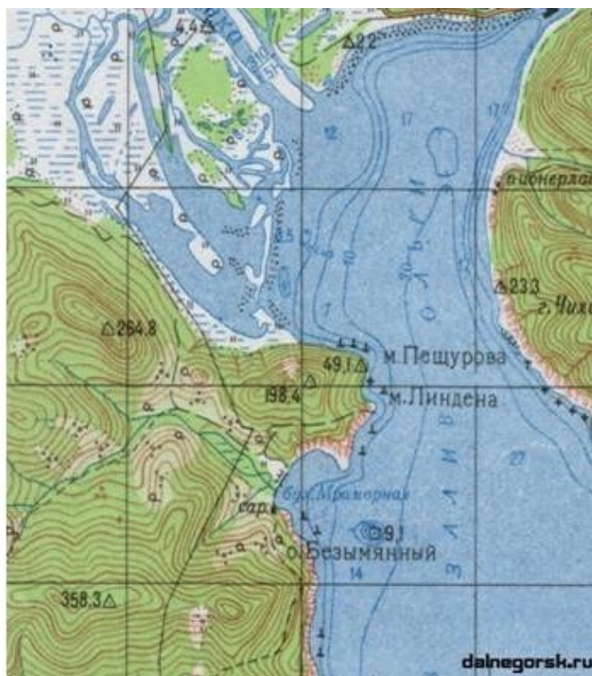
Карта: «Залив Ольги».

Писатель Валентин Саввич Пикуль в романе «Три возраста окини сан» написал о драматической судьбе Владимира Коковцева, прошедшего путь от мичмана до адмирала российского флота. В этом же романе Пикуль рассказал и о морском офицере Алексее Алексеевиче Пещурове.