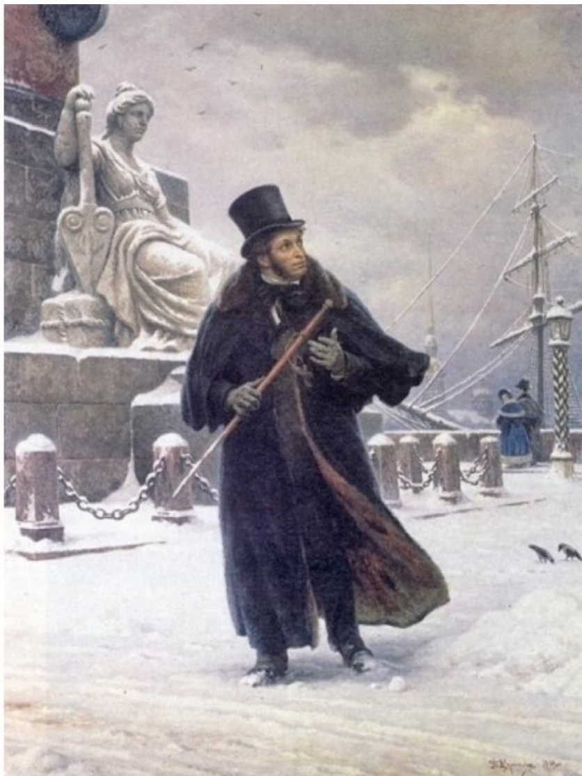
Б. В. Щербаков. «Пушкин в Петербурге». 1949г.

А эта песня так и осталась «гимном» небольшого сибирского города.