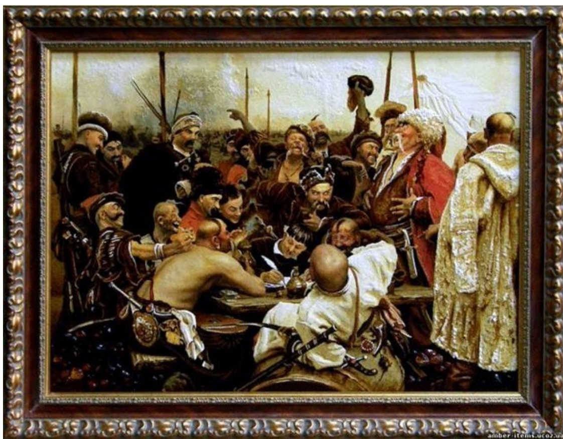
Репин «Запорожцы пишут письмо турецкому султану».

Со словами: «Я вашу М-ть!!!...», он еще долго с лопатой гонялся за нами по улице. Иван Купала.