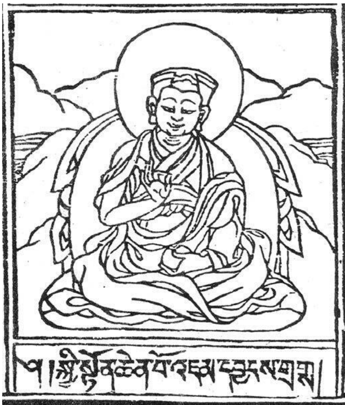
Ил. 2. Кытон Джамьянг Драгпа Гьялцен. Один из двух основных учителей Долпопы. Гравюра на дереве, XX век. Ngawang Lodrö Drakpa, History of the Jonang Tradition , 107. Dharamsala: Library of Tibetan Works and Archives, 1993

В 1309 году, когда Долпопе было семнадцать лет, без родительского разрешения он втайне сбежал из дома и, преодолев множество трудностей, предстал перед учителем Кытоном в Верхнем Мустанге. Там он получил много наставлений по колеснице совершенств, эпистемологии, космологии и психологии. Всего за месяц интенсивного изучения Долпопа освоил специфическую дхармическую терминологию, связанную с каждым из этих направлений буддийского знания, и мог вступать в формальные диспуты, чем впервые привлек внимание окружающих 18 . Вскоре Кытон получил срочное послание от дяди – Шакьи Бума, пригласившего