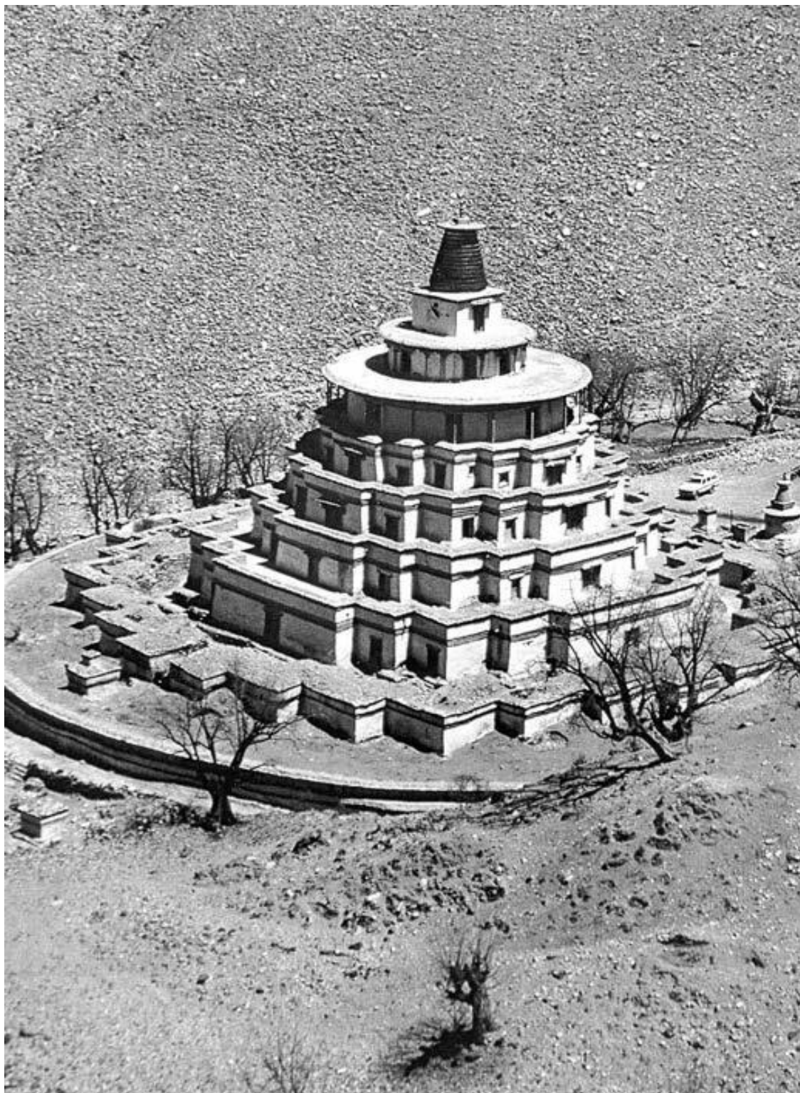
Ил. 5. Великая ступа Джонанг. Значительные повреждения устранены за последние несколько лет.

К тому времени вокруг Долпопы сформировалась группа исключительно одаренных йогов, ученых и переводчиков. Среди них были Кунпанг Чодраг Палзанг, Мати Панчен Лодро Гьялцен (1294–1376), Лодро Пал (1299–1354) и Чогле Намгьял (1306–1386), кото-