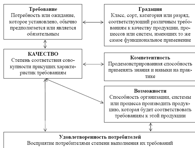
Рис. 1. Понятия, относящиеся к качеству (выдержка из ГОСТ ISO 9000–2011)