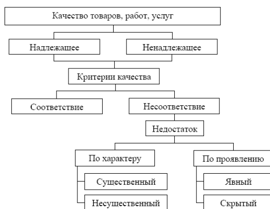
Рис. 3. Качество товаров, работ, услуг в соответствии с Законом о защите прав потребителей

1. Свойства – характеристики или признаки, присущие труду, товарам, продукции, услугам, работам. Указанные свойства не зависят от желания потребителя и отражают объективную сторону качества.