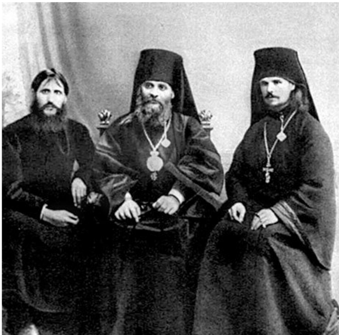
Распутин, епископ Гермоген и иеромонах Илиодор

Я начал готовиться к приему гостей. Кое-что народу сказал о старце, сильном у высоких людей и возвратившем меня из Минска в Царицын.