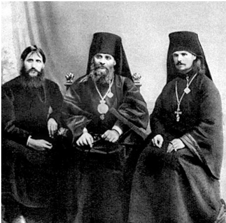
Распутин, епископ Гермоген и иеромонах Илиодор

Я начал готовиться к приему гостей. Кое-что народу сказал о старце, сильном у высоких людей и возвратившем меня из Минска в Царицын.