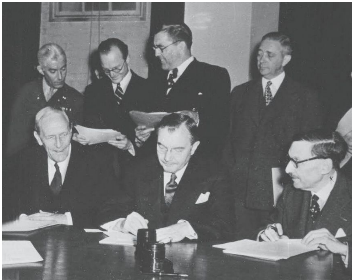
Лондон. 8 августа 1945 года. Подписание Соглашения об учреждении Международного военного трибунала. На снимке – сверху (слева направо): профессор А.Н. Трайнин, И.Т. Никитченко (СССР); внизу – Джоуитт (Великобритания); Р. Джексон (США); Р. Фалько (Франция).