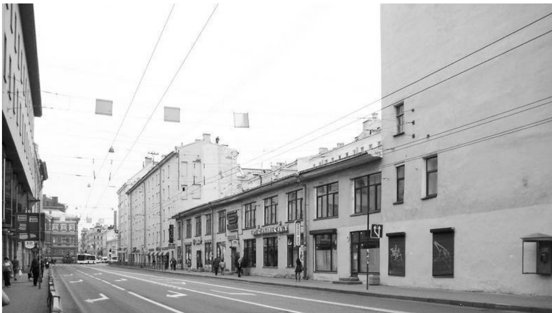
Суворовский пр., 1а / Невский пр., 128. Фасад со стороны Суворовского проспекта. 2015 г.

Я.П. Волостных (1910–1945), уроженец Петербурга, призван в Красную армию Сталинским РВК Ленинграда. Красноармеец, санитар 72-й Краснознаменной горно-стрелковой бригады 126-го легкого горнострелкового корпуса 38-й армии 4-го Украинского фронта. Умер от ран 29 марта 1945 г. в Хирургическом полевом подвижном госпитале № 5148. Похоронен на воинском захоронении на общем кладбище в местечке Янковец местности Пшына Краковского воеводства (Польша) 11 .