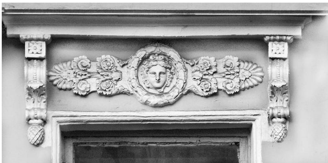
Суворовский 1а / Невский пр., 128. Маскарон