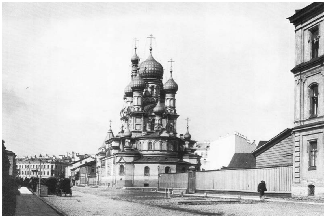
Церковь во имя Шестаковской иконы Божией Матери. 1900-е гг.

Пески принадлежали артиллерийскому ведомству и стали местом пребывания войск императорской гвардии – Преображенского и Конногвардейского полков, лейб-гвардии Саперного батальона и гвардейской Конной артиллерии.