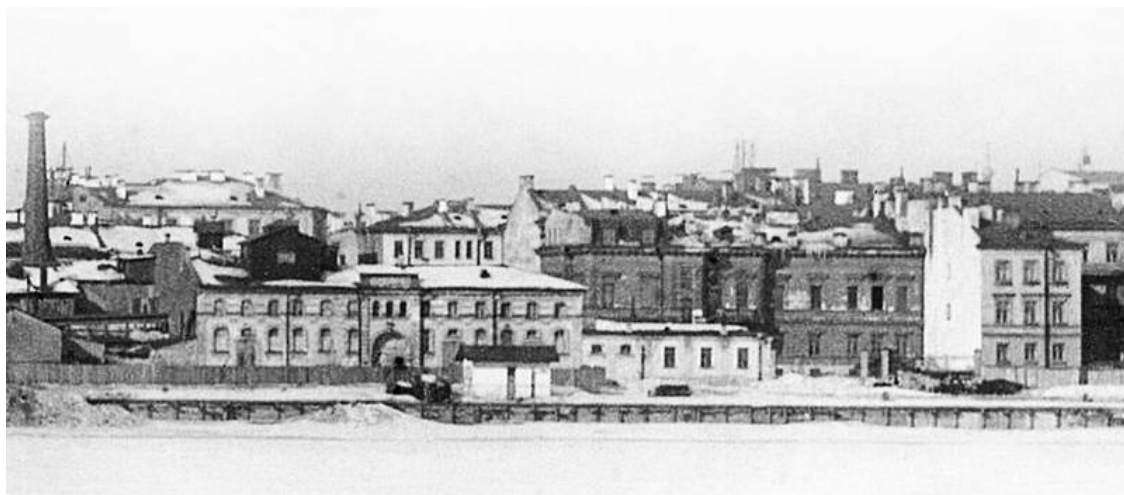
Калашниковская набережная. 1900-е гг.

В 1870-х гг. архитекторы А.Э. Юргенс и Р.А. Гедике построили на набережной казенный винный завод Министерства финансов (Синопская наб., 56–58). Возводились здесь жилые и культовые постройки. Архитектор А.И. Очаков построил на набережной часовню Святителя Николая Чудотворца Валаамского Спасо-Преображенского мужского монастыря (Синопская наб., 34). По проекту профессора архитектуры М.А. Шурупова при участии архитектора А.И. Резанова в створе Калашниковского проспекта на средства хлеботорговцев Калашниковской биржи построена церковь во имя Святых князей Бориса и Глеба (освящена в 1882 г., закрыта в 1935 г., окончательно разрушена в 1975 г.).