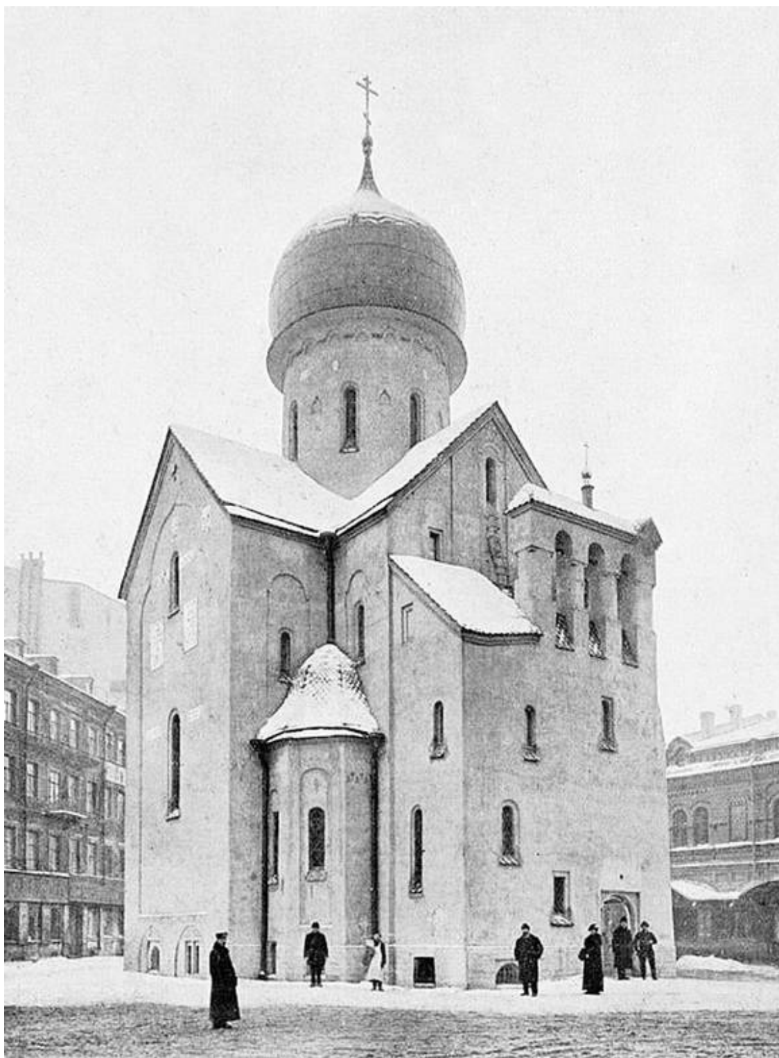
Церковь Святителя Николая Мирликийского и Святого Благоверного князя Александра Невского. 1916 г.