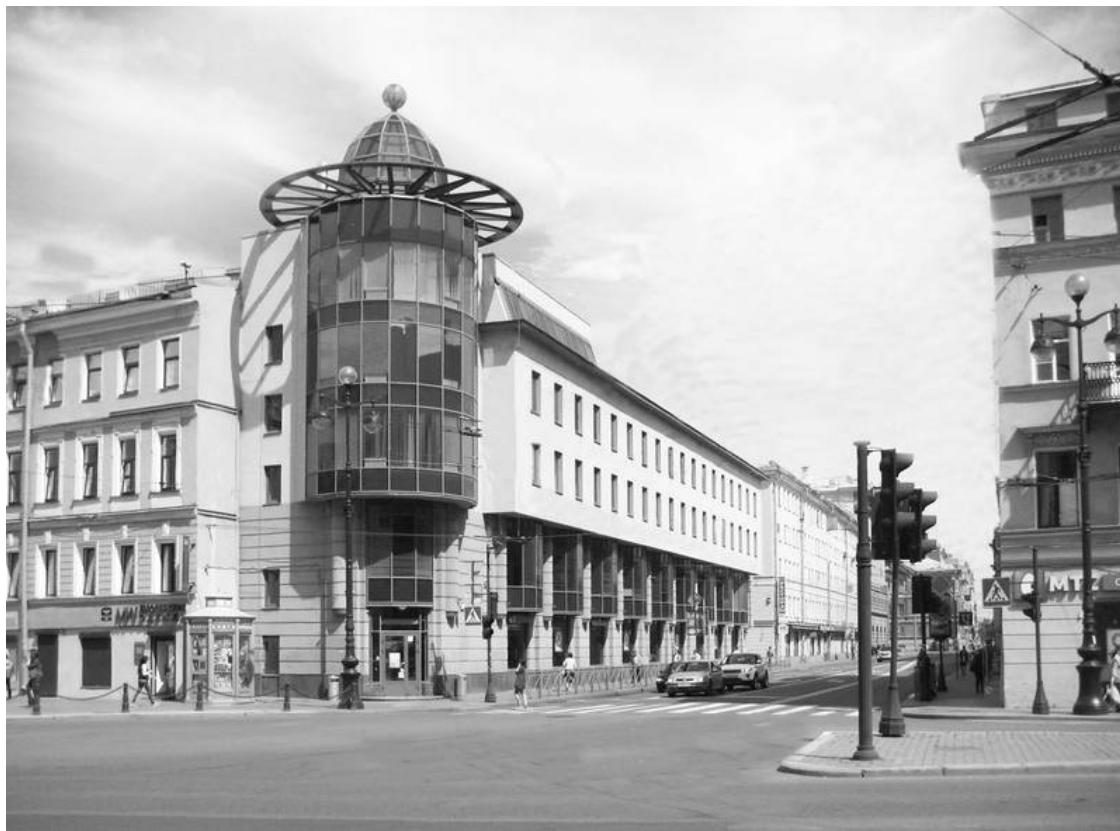
Суворовский пр., 2А. 2015 г.