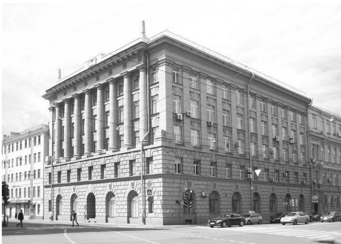
Суворовский пр., 2х. 2015 г.

В.М. Черниго родился в Петербурге в 1885 г. Окончил Петербургский университет по юридическому и экономическому отделениям в 1911 г. В том же году поступил в Министерство юстиции и был командирован в Сенат в качестве кандидата. В 1917 г. служил в 1-м департаменте Сената в ранге коллежского секретаря. Основной его работой был ревизионный контроль деятельности промышленных предприятий, главным образом Акционерных обществ. В 1918 г. поступил на должность штатного преподавателя военных училищ комсостава РККА, где и оставался до 1924 г. включительно в должности главного руководителя.