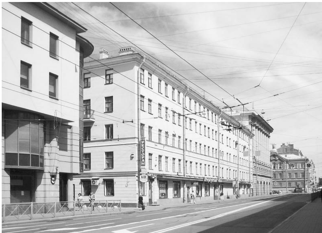
Суворовский пр., 2. 2015 г.