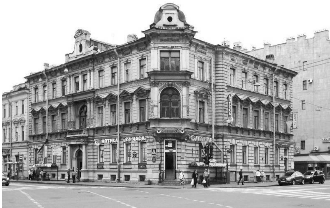
Суворовский пр., 16. 2015 г.