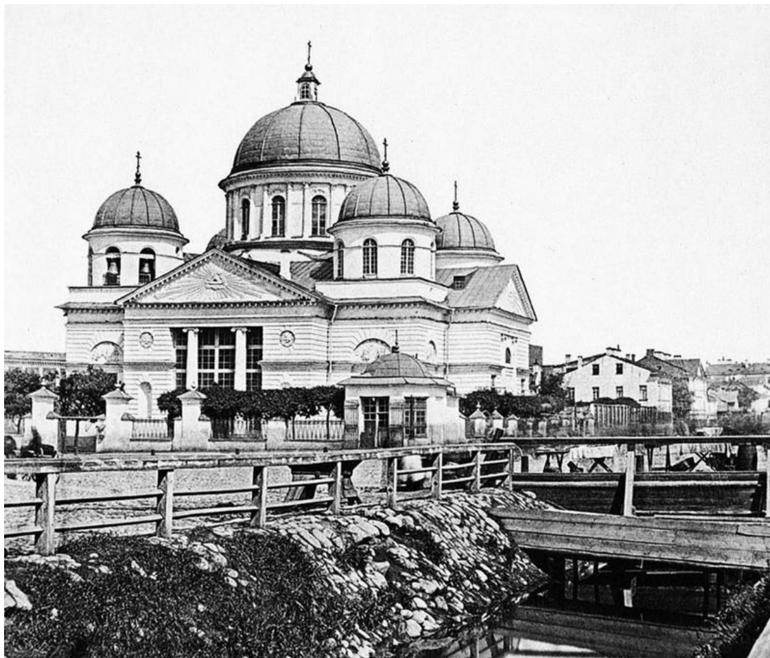
Знаменская церковь. 1900-е гг.