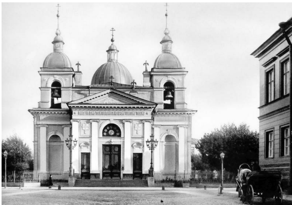
Церковь Рождества Христова. 1900-е гг.

На Песках построили первый в Петербурге храм Рождества Христова, давший впоследствии название всей местности, ав 1811 г. – вновь образованной полицейской части. С 1720-х гг. здесь стояла деревянная церковь. В 1752–1753 гг. для переселенных в этот район служителей Канцелярии строения домов и садов, ведавшей строительством дворцов и придворных зданий в первом 50-летию существования Петербурга, был выстроен взамен прежнего новый, также деревянный, храм во имя Рождества Христова с приделом во имя Всех Святых. В 1781–1789 гг. по проекту П.Е. Егорова на площади, получившей впоследствии название Рождественской, построили каменный трехпрестольный храм на 3000 человек. Росписи и образа для него выполнили известнейшие русские живописцы. Освящение храма совершили при участии цесаревича Павла Петровича. В 1850–1851 гг. и 1886–1887 гг. храм расширялся и реставрировался. Перед местным образом Рождества Христова, почитавшимся покровителем Песков, по традиции молились о помощи в родах и воспитании детей. В 1863 г. при храме создано первое в России приходское благотворительное братство со школой, приютом, богадельней и собственной церковью. Храм закрыт и разрушен в 1934 г.