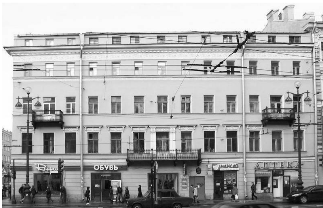
Суворовский пр., 1А / Невский пр., 128. Фасад со стороны Невского проспекта