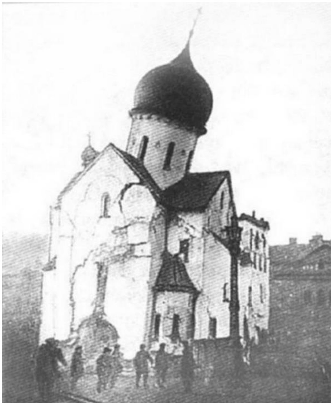
Церковь Святителя Николая Мирликийского и Святого Благоверного князя Александра Невского. Слом в 1932 г.