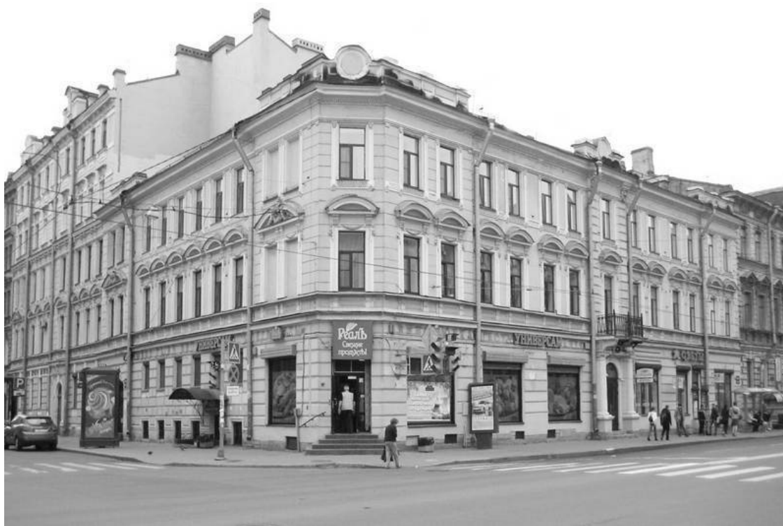
Суворовский пр., 3. 2015 г.