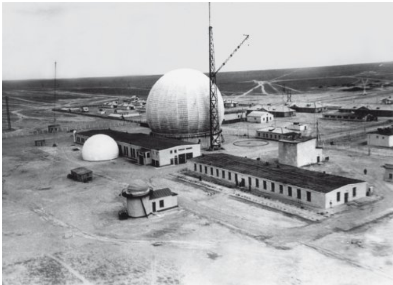
Радиолокатор точного наведения РТН-2