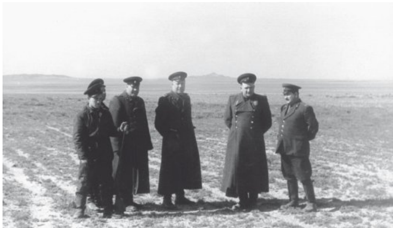
Полигон ПРО Балхаш