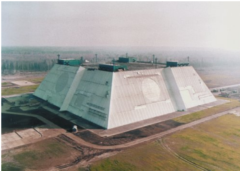
Многофункциональная РЛС 5Н20