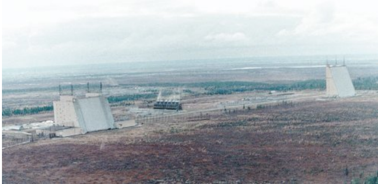
Радиолокационная станция СПРН «Дарьял»