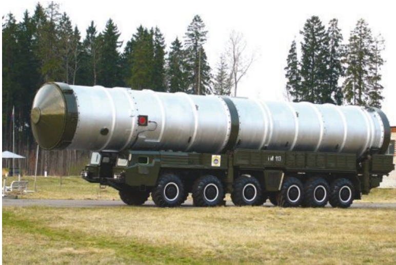
Противоракета на транспортной машине