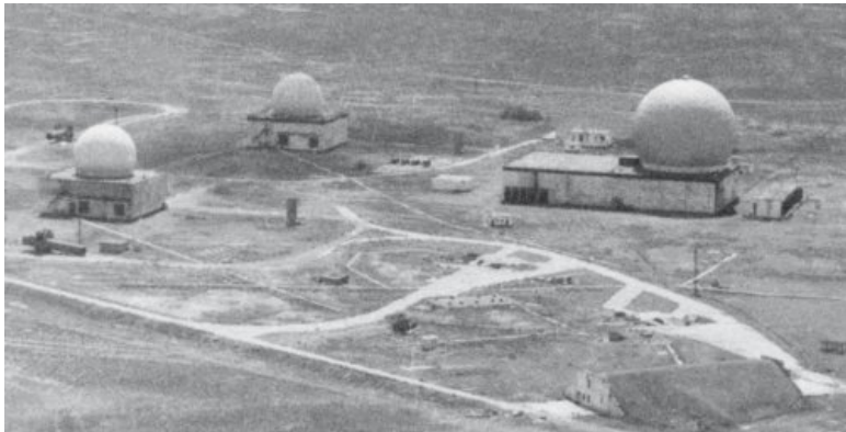
Стрельбовый комплекс ПРО «Алдан»