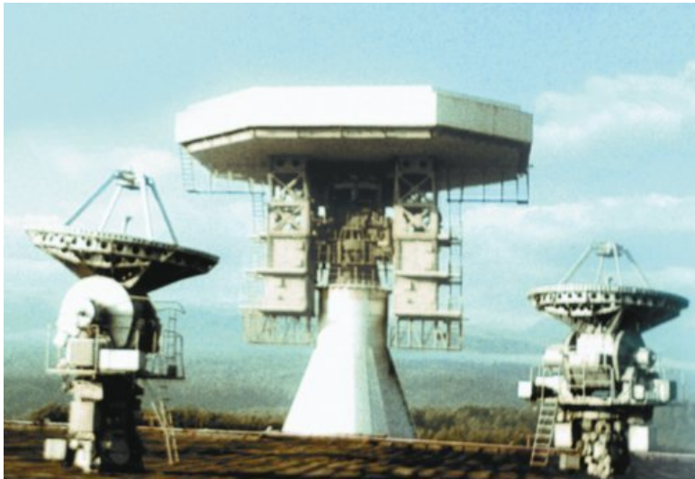
Радиооптический комплекс распознавания «Крона»