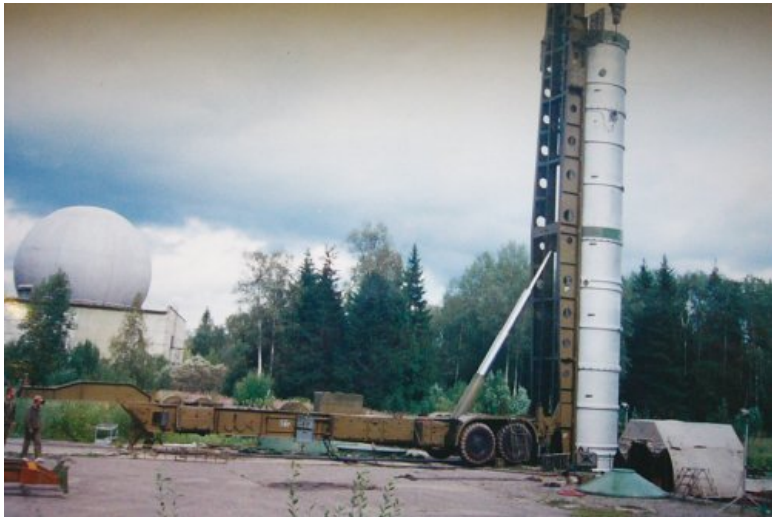
Установка противоракеты А-925 в ШПУ