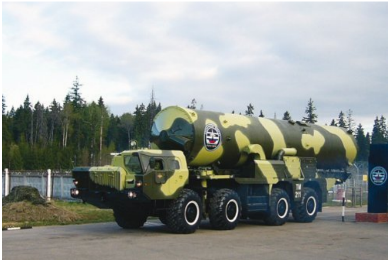
Противоракета ПРС на марше