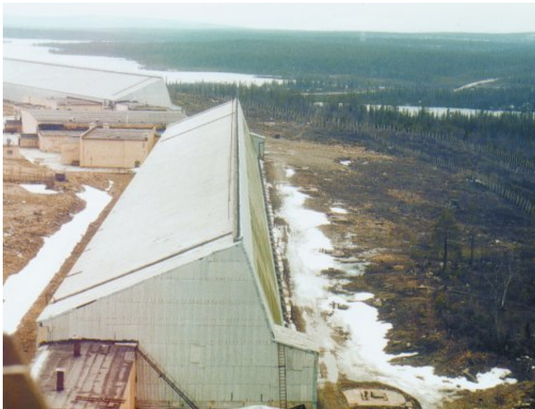
Радиолокационная станция СПРН «Днепр»