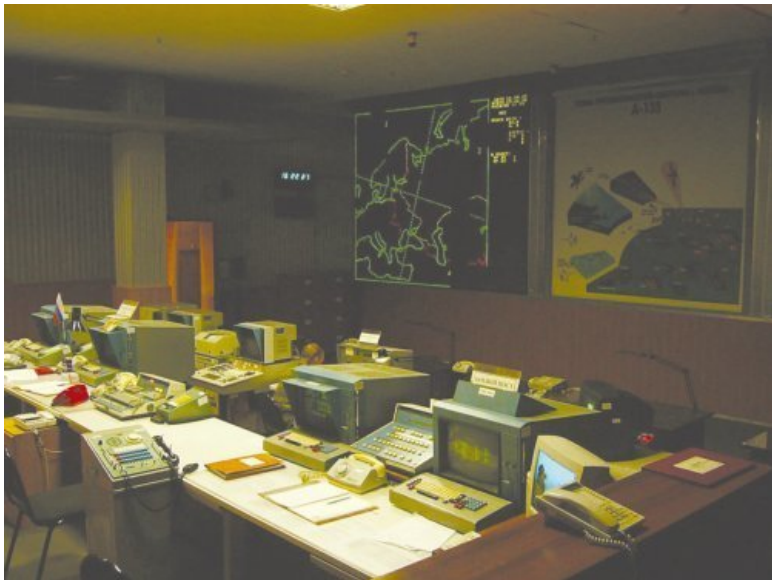
Командный пункт системы ПРО