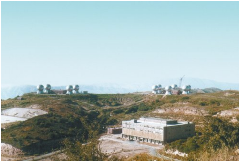
Оптико-электронный комплекс «Окно»