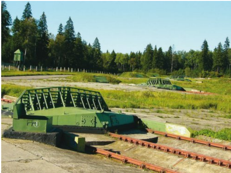
Шахтная пусковая установка ПР