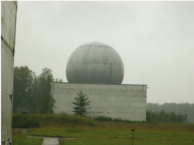
Радиолокатор канала изделия системы ПРО