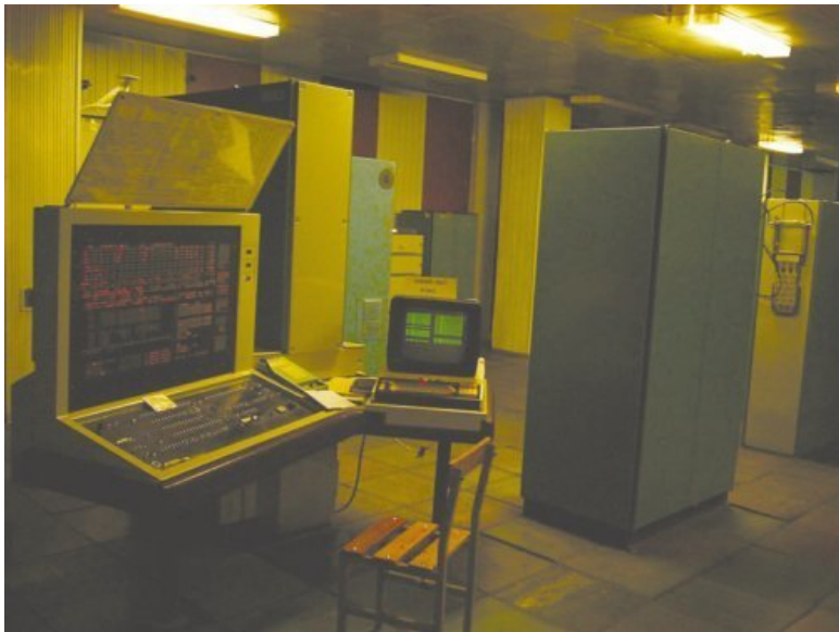
Сверхбыстродействующая ЭВМ «Эльбрус»