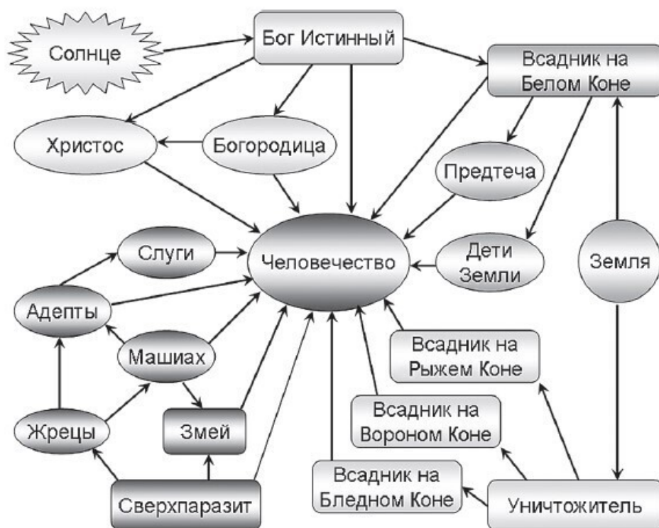
Рис. 3. Состав и структура основных сил, воздействующих на человечество со стороны интегральных информационных существ

Примечательно, что практически все ключевые персонажи со стороны человечества были описаны в древних и современных пророчествах и предсказаниях. Новой, ранее не описанной силой являются «Дети Земли». К ним, собственно, относятся и Предтеча, а также ожидаемые «пророки последних времен» – Илия и Енох. О «Детях Земли» известно только то, что они уже есть и продолжают рождаться. У каждого из них есть свое предназначение,