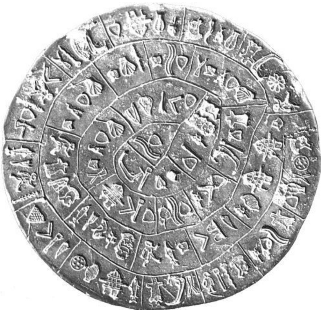
Рис. 2.2. Фестский диск минойской цивилизации. II тыс. до н. э.

массивов информации в блоки разной величины. В третьем тыс. до н. э. в египетских письменах начали использоваться значки, имеющие фонетическое значение. Несколько позже стали появляться слоговые и буквенно-звуковые (алфавитные) системы письменности. Изобретение первого алфавита приписывается финикийцам и состоит он из 22 знаков, каждый из которых соответствует определенному звуку. Самые ранние следы этой письменности найдены на Синае и датируются 1400 годом до н. э. Благодаря ее простоте развитие торговли Средиземноморья получило мощный импульс, а за этим следовал культурный и технологический обмен. В III тыс. до н. э. в Междуречье появилась система счета, кратная 6 (магической цифре того времени). Благодаря этому у нас сейчас 60 секунд, 60 минут и 360 градусов. Из материалов египетских трактатов конца III тыс. до н. э. мы знаем, что у них была десятиричная система счета и они знали четыре арифметических действия. Но и в этом случае были найдены кости верхнего палеолита с группами насечек, кратными 10 [3]. Причем кости на месте насечек заглаживались, что говорит о специальном отношении к этому процессу. Были даже найдены попытки стирания этих линий (уж не при погашении ли долга?!), а также печати, которые прикладывались к глине или с помощью краски делались отпечатки. Но все же основные находки древней письменности и счета (на глиняных табличках) относятся к Междуречью и на камне – к Египту.