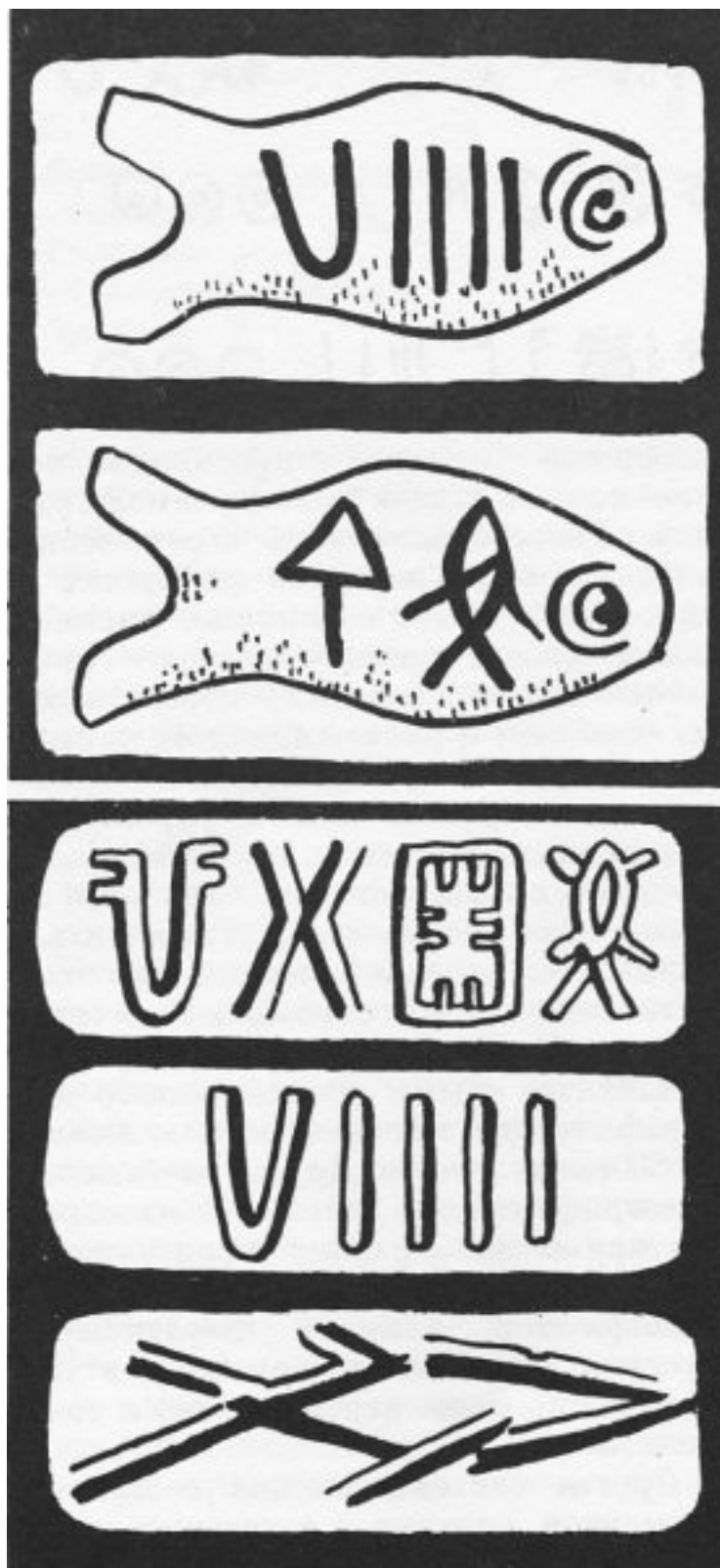
Рис. 2.1. Пиктографическая письменность цивилизации Мохенджо Даро. III – II тысячелетие до н. э.

Следует заметить, что на нем, наверное, впервые в мире был применен способ выдавливания значков индивидуальными печатями, некий прототип печатного станка, можно обнаружить спиральную запись информации, как на современном жестком диске, и объединение