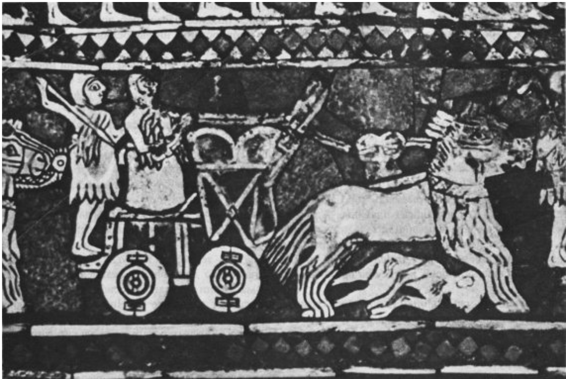
Рис. 2.4. Шумерская боевая повозка. Мозаика из царских гробниц г. Ур. Около 2500 г. до н. э.