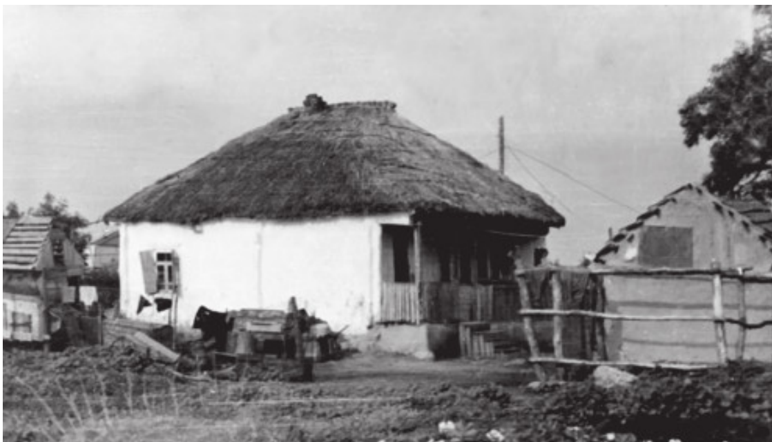
Казачья хата-мазанка, середина XX века

Каневская уже тогда была очень большой станицей с тридцатью тысячами жителей, живущих в хатах-мазанках с земляными полами под камышовыми крышами. Отец нашел здесь понятную ему работу по созданию местного радиоузла. Тогда нашу семью спасло слабое развитие электроники и полное отсутствие информационных технологий в НКВД. Поняв опасность, отец с семьей просто исчез из Вольска, и никто не мог найти его в огромной стране.