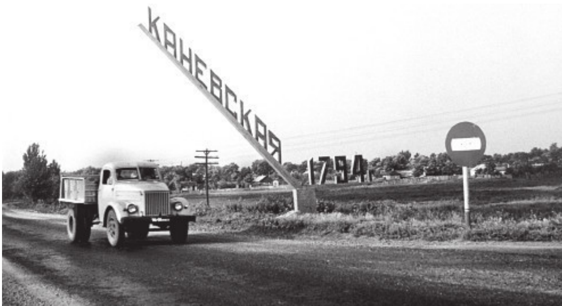
Станица Каневская – крупнейшая в стране, 1983 г.

Каневская уже тогда была очень большой станицей с тридцатью тысячами жителей, живущих в хатах-мазанках с земляными полами под камышовыми крышами. Отец нашел здесь понятную ему работу по созданию местного радиоузла. Тогда нашу семью спасло слабое развитие электроники и полное отсутствие информационных технологий в НКВД. Поняв опасность, отец с семьей просто исчез из Вольска, и никто не мог найти его в огромной стране.