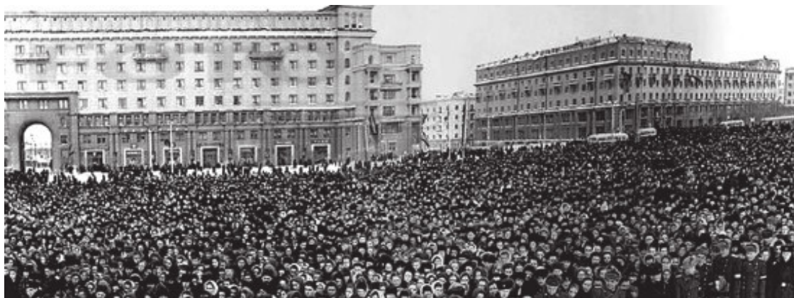
На улицах Москвы в дни прощания с И.В. Сталиным

Когда в ночь с 5-го на 6-е марта 1953 года после митинга в Большом актовом зале (БАЗ) МХТИ по поводу смерти великого вождя всех народов и всех времен несколько тысяч мendeleeвцев согласно партийной разнарядке отправились через метро «Кировская» на Сретенский бульвар. Он уже в 19 часов был плотно набит трагически страдающим человечеством. Примерно к 23 часам это огромное спрессованное человеческое тело, пропитанное ужасом, скорбью, безнадежностью дотекло до Трубной площади. Там эту лаву остановили пять рядов американских «Студебеккеров» с солдатами. А сверху от метро оголтелые и невменяемые от Вселенской Трагедии, потерявшие себя во времени и пространстве почти уже и не люди напирали на тех, кому уже не суждено было двигаться. Метро, как выходная часть непрерывно работающей мясорубки, выплескивало при каждом повороте шнека все новых и новых плакальщиков и плакальщиц. Это зрелище было посильнее пинкфлойдовской «Стены», но по обреченности выглядело похоже.