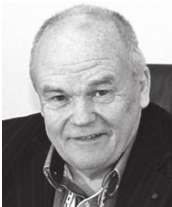
Велихов Евгений Павлович

Велихов Е.П., академик РАН, профессор, Герой Социалистического Труда, лауреат Ленинской и Государственной премий СССР, Государственной премии РФ