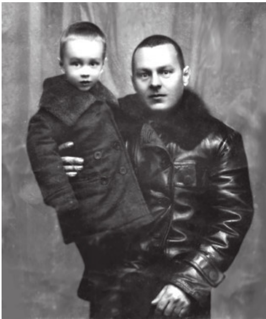
Первая фотография, с отцом, 1935 г.

В аппаратной было много интересного: приборы со стрелками, переключателями, верньерами, шкалами, лампочками; дежурные, непрерывно что-то подстраивающие, линейные монтеры с огромными стальными крюками – «кошками» для лазания по столбам, периодически появляющиеся в аппаратной. Но главный интерес – усилительная стойка. Черная, возвышающаяся над всей аппаратурой на своем постоянном главном месте – для меня она была живой.