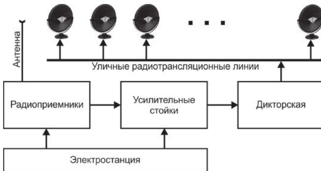
Схема районного радиоузла

Монтеры – здоровые молодые парни с поясами и мощными «кошками», которые лихо лазили по столбам, предварительно ими же врытыми в землю на полтора метра, и вручную натягивали двухпроводную линию из железных проводов. Дальше от столба провода шли в хату, и там вешался репродуктор с черным бумажным диффузором диаметром около полуметра. Как потом выяснилось, производства в том числе и «будущего» завода № 311 («Сапфир»).