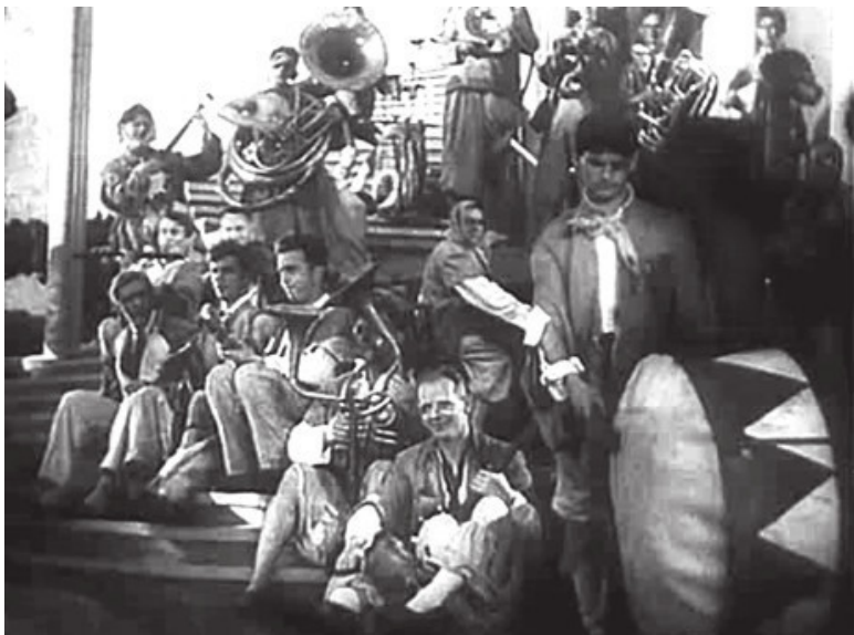
Джаз Утесова. Кадр из фильма «Веселые ребята»