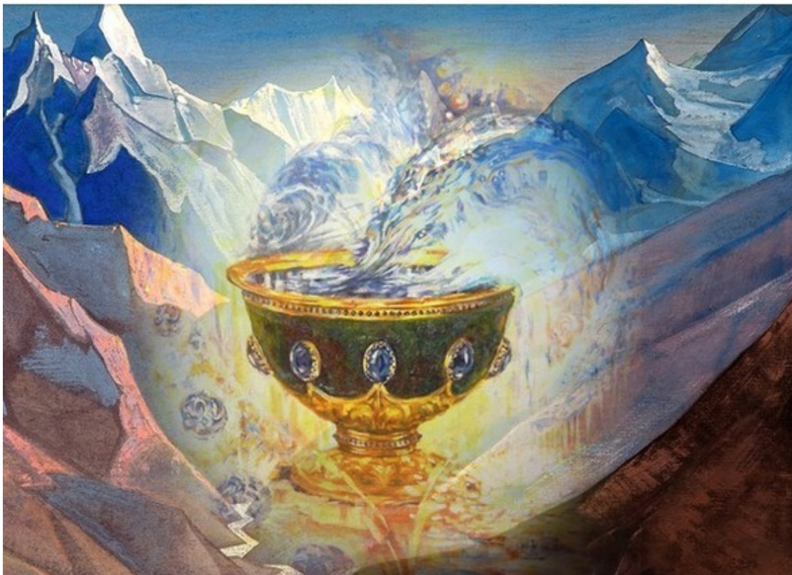
Н. К. Рерих

Чаша Грааля является хранилищем Энергии, которая питает тело, соединяет человека с Высшим Разумом и помогает получить помощь. В Чаше Грааля лежит «крылатый ребенок» – так в древности называлась Энергия нашего Сознания.