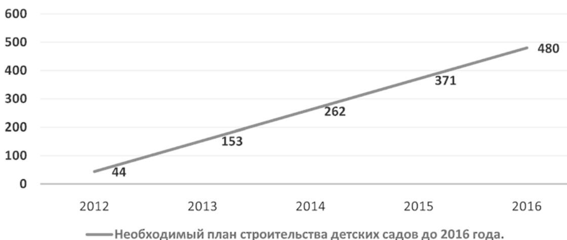
Рис. 5. Необходимый план строительства детских садов до 2016 г.