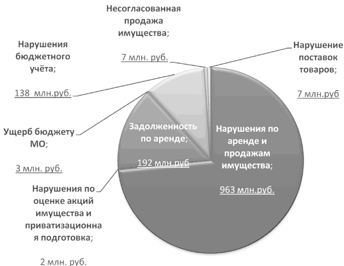
Рис. 1. Нарушения Минимущества за 2011–2013 гг.

Все перечисленные нарушения Минимущества за период 2011–2013 гг. представлены на рис. 1.