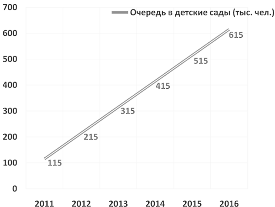
Рис. 3. Динамика роста очередей до 2016 г.