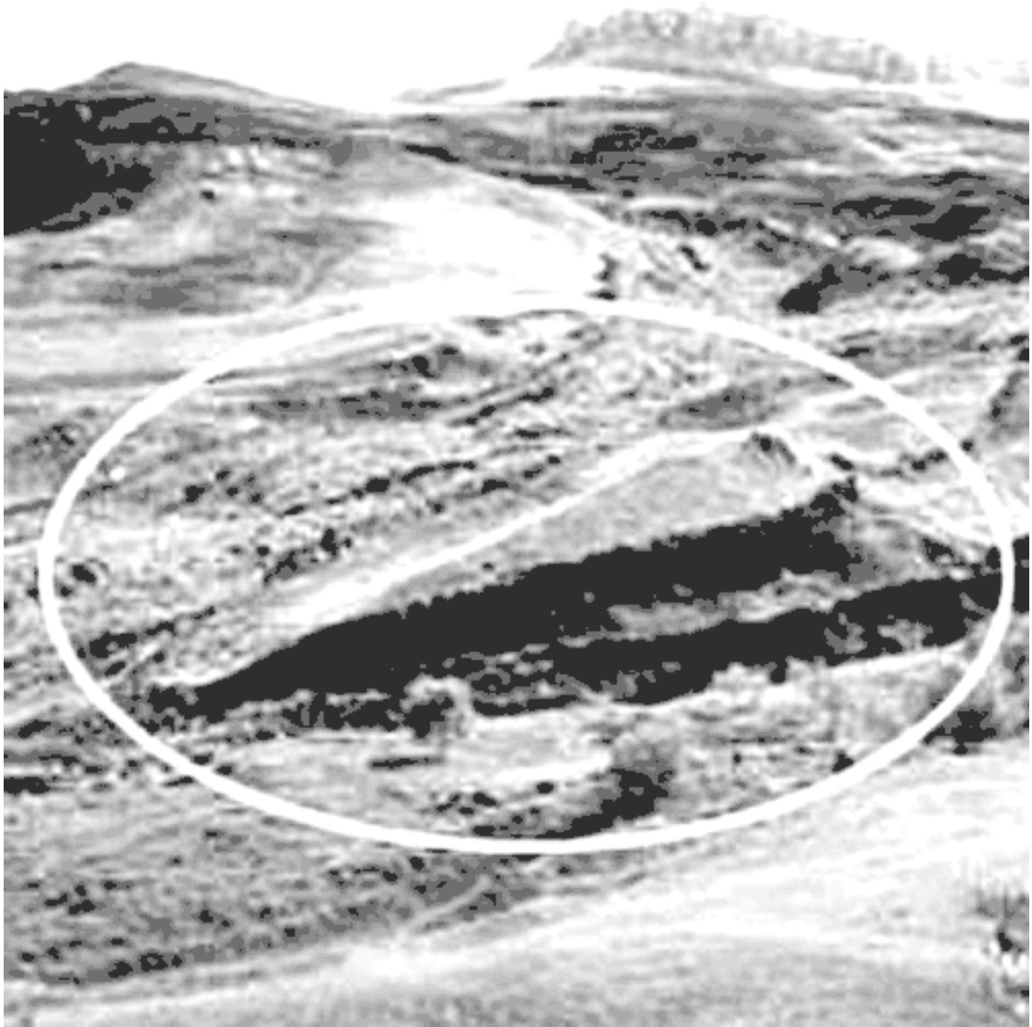
Некое геологическое образование, которое считается остатками ковчега