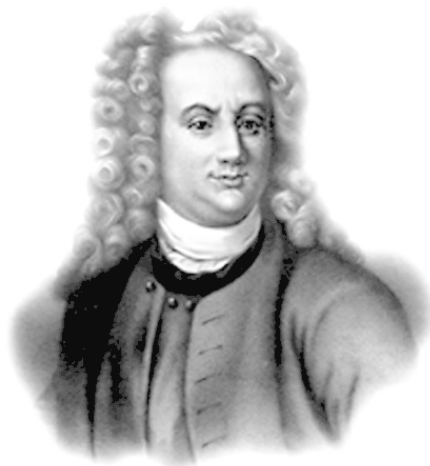
Василий Никитич Татищев (1686–1750)

И первым среди них надо назвать Василия Никитича Татищева (1686–1750), солдата, ученого, политика, чиновника, исследователя. Он участвовал в Полтавском сражении, руководил металлургическими заводами, осваивал Южный Урал и Северный Казахстан, основал Екатеринбург. Но в веках прославила его имя написанная им «История Российская», три тома которой донесли до нас бесценные сокровища русских летописей, уничтоженных затем в московском пожаре 1812 года.