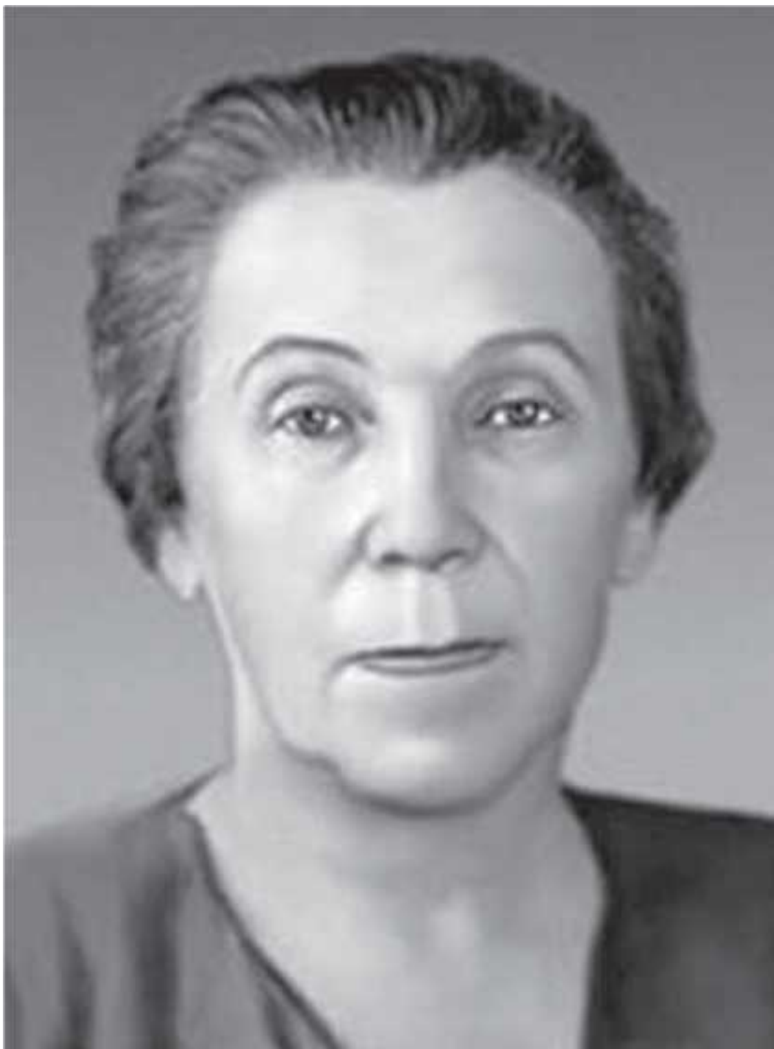
Портрет Л.А. Фотиевой

Вступила в партию большевиков в 1904 году, участвовала в революциях 1905 г., февральской и октябрьской 1917 г.