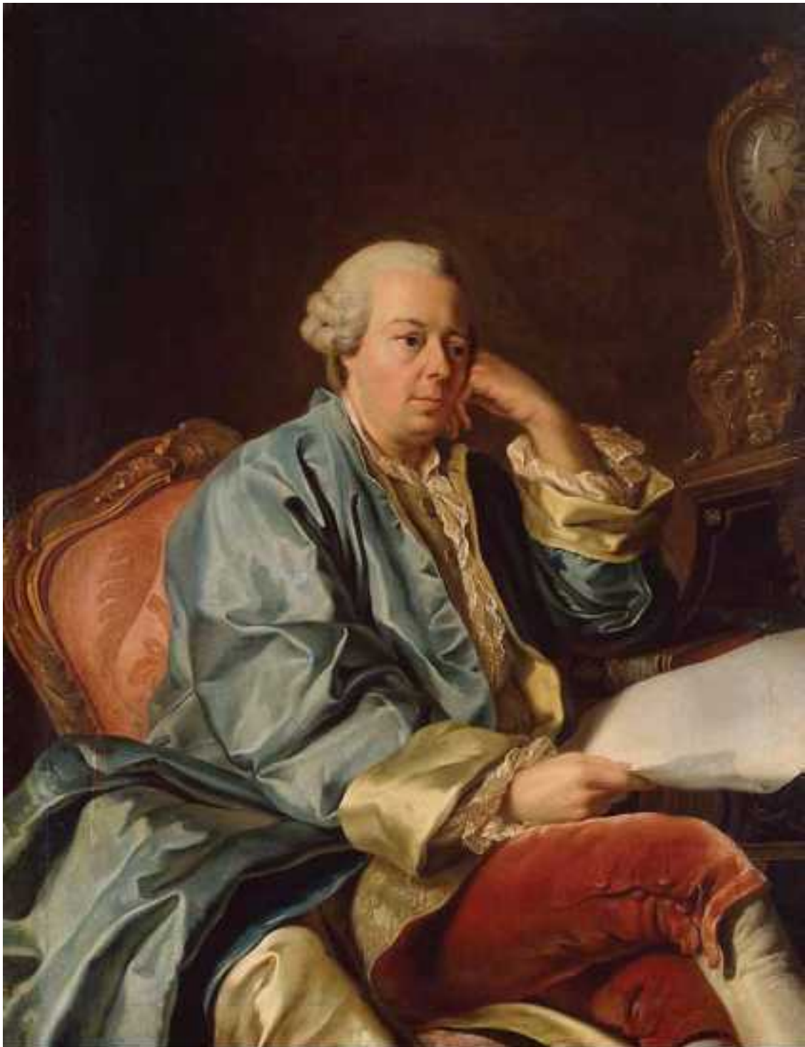
Портрет И.И. Бецкого

С 1775 г. – секретарь Екатерины II, в 1780-е годы он стал старшим среди статс-секретарей императрицы, пользовался ее исключительным доверием и благосклонностью. Она ставила на всех документах с его резолюцией только одну пометку: «Быть по сему» [2].