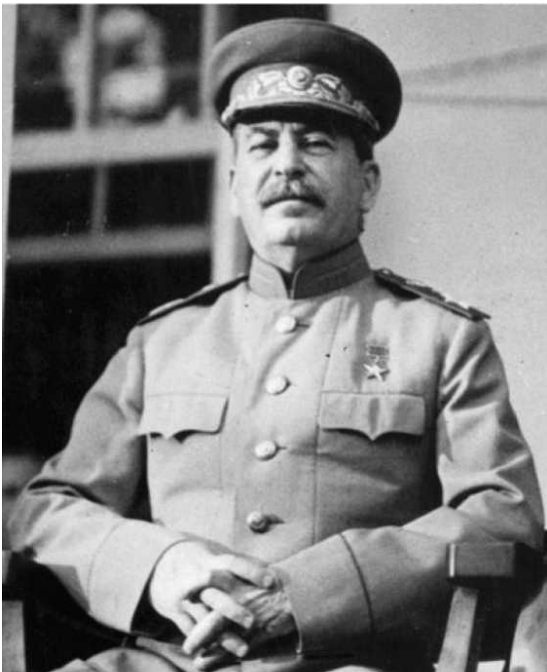
Портрет И.В. Сталина

ИТУ издает работы, освещающие вопросы секретарского труда, однако, деятельность его признается вредной, находящейся под влиянием буржуазных идей. ИТУ был ликвидирован в апреле 1932 года. Многие специалисты его были репрессированы.