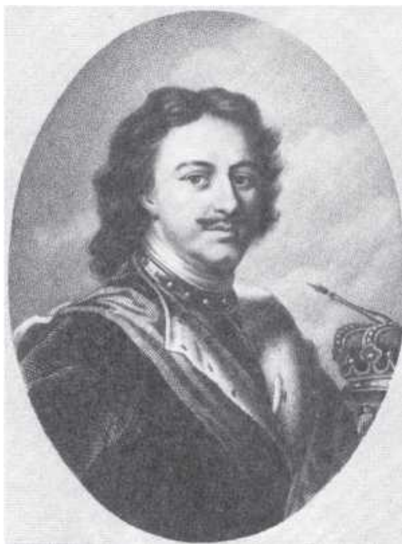
Портрет императора Петра I

Секрет – то, что не подлежит разглашению, что скрывается от других, тайна.