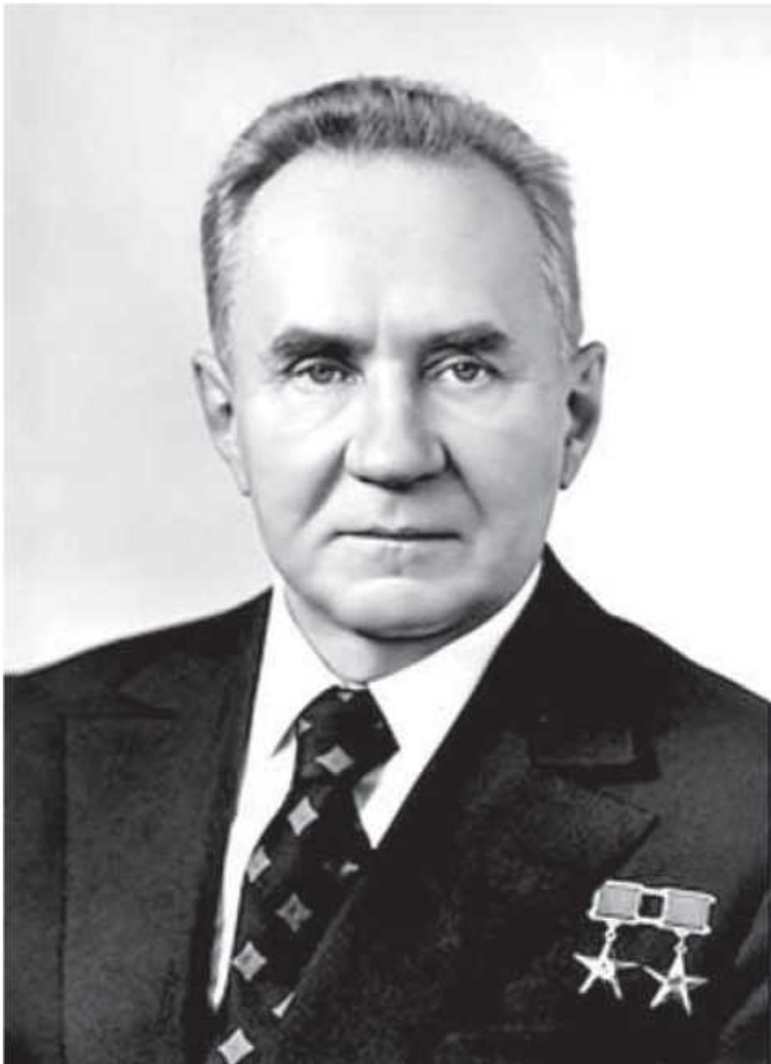
Портрет А.Н. Косыгина

В Единой государственной системе делопроизводства была закреплена роль секретаря в зависимости от категории учреждения. Категория определялась объемом документооборота, в зависимости от которого складывалась структура делопроизводственной службы. Всего устанавливалось 3 категории учреждений.