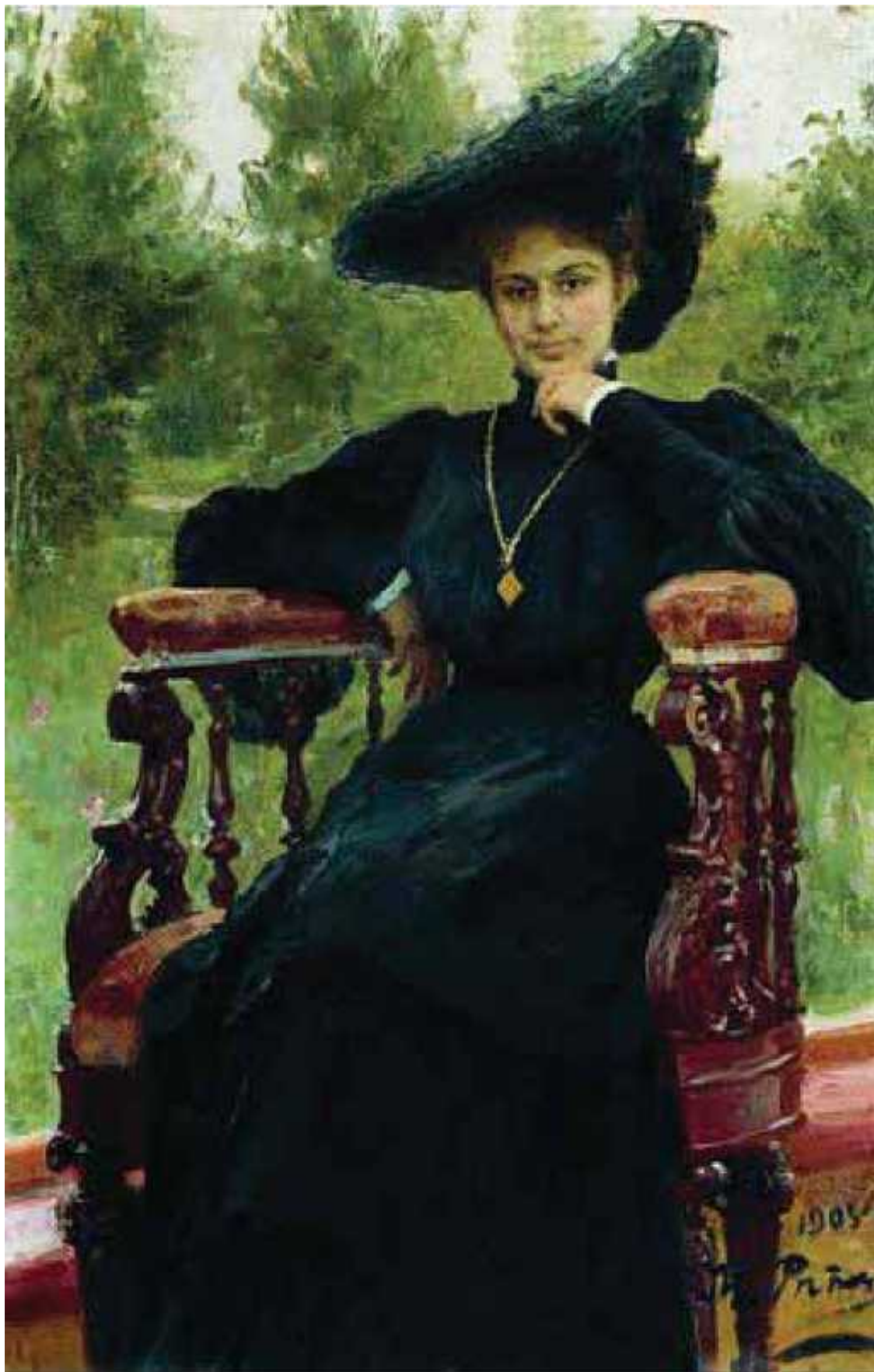
Портрет М.Ф. Андреевой