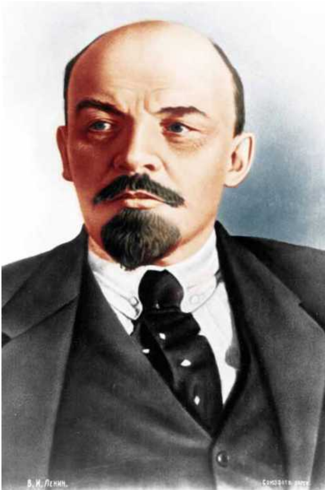
Портрет В.И. Ленина

Новый государственный аппарат по своей структуре принципиально отличался от старого.