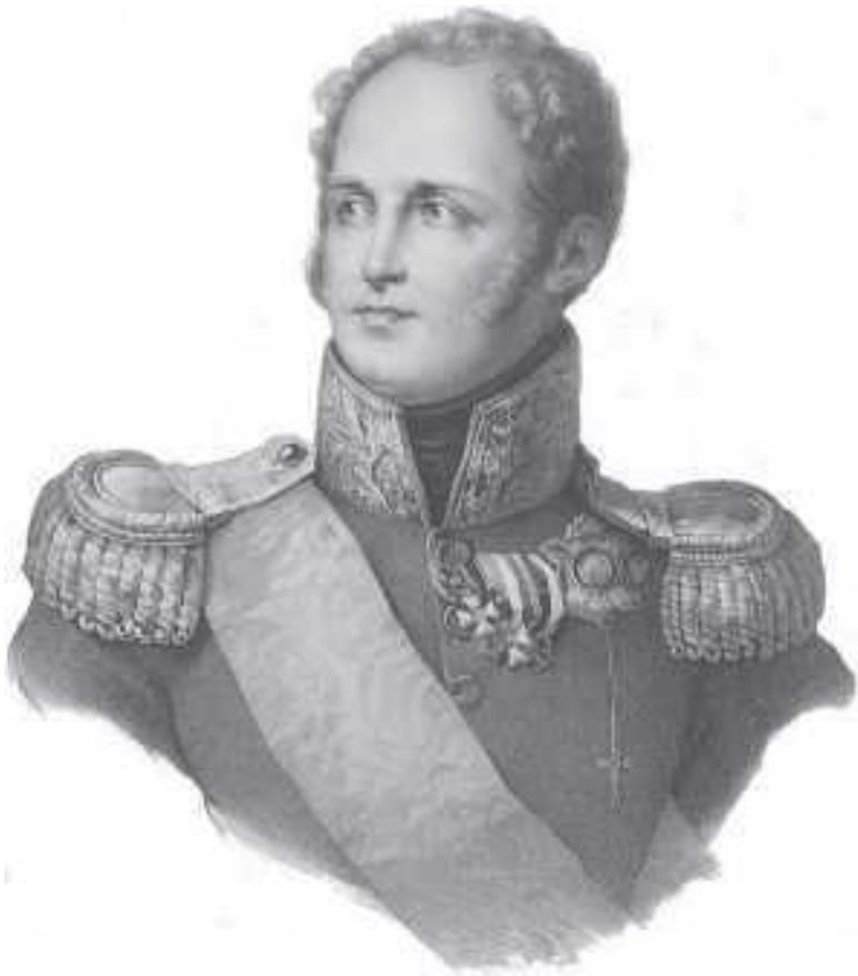
Портрет императора Александра I

В XVIII в. в государственных учреждениях, местных органах управления – присутственных местах – секретари играли