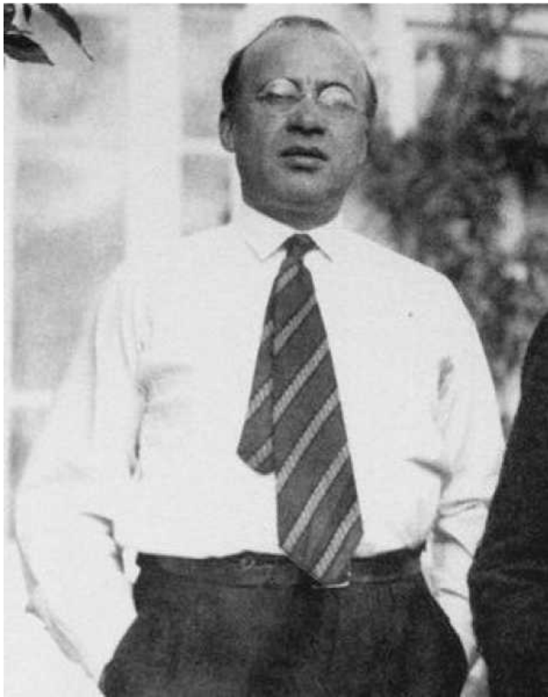
Портрет П.П. Крючкова