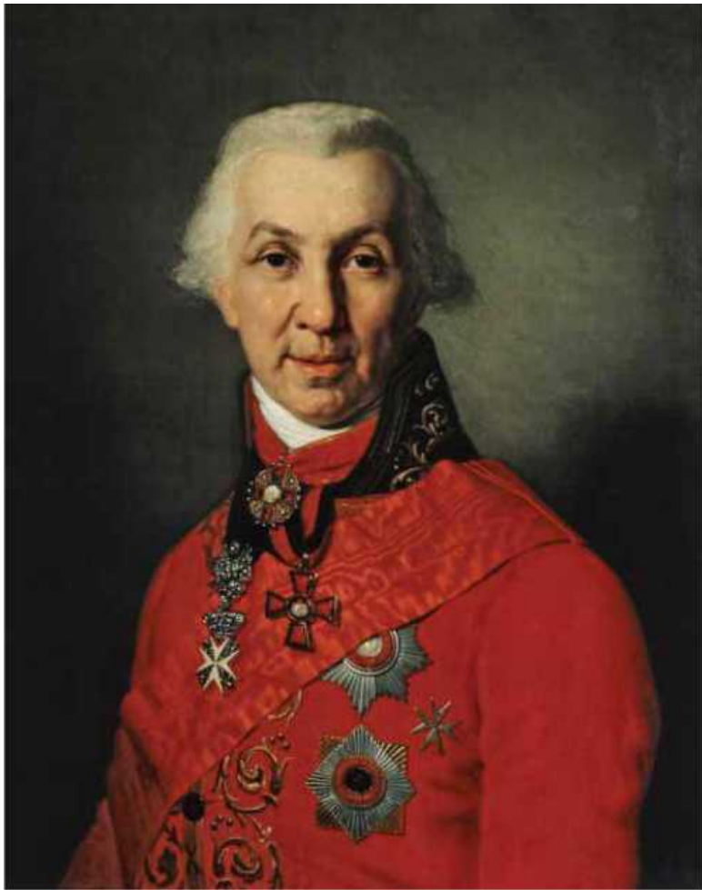
Портрет Г.Р. Державина