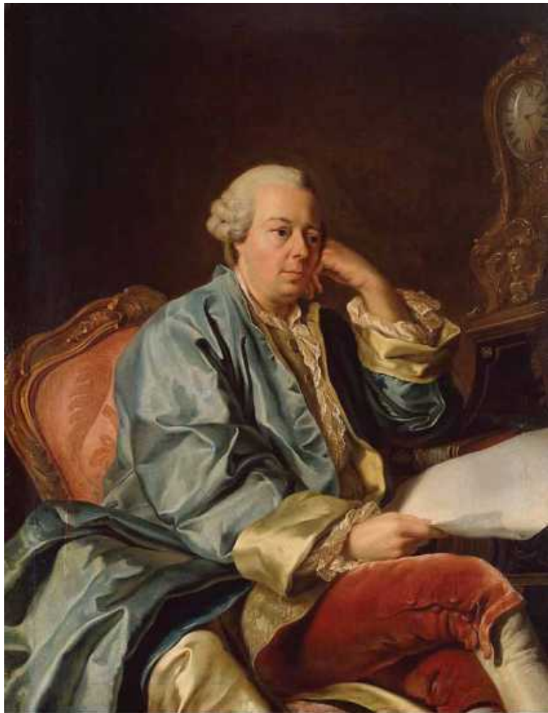
Портрет И.И. Бецкого