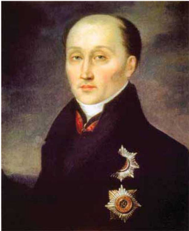
Портрет М.М. Сперанского