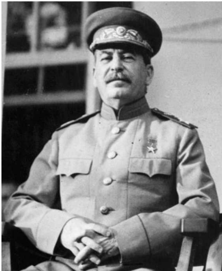
Портрет И.В. Сталина

ИТУ издает работы, освещающие вопросы секретарского