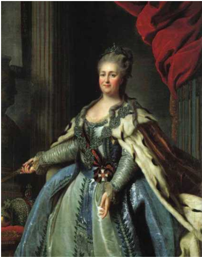
Портрет императрицы Екатерины II