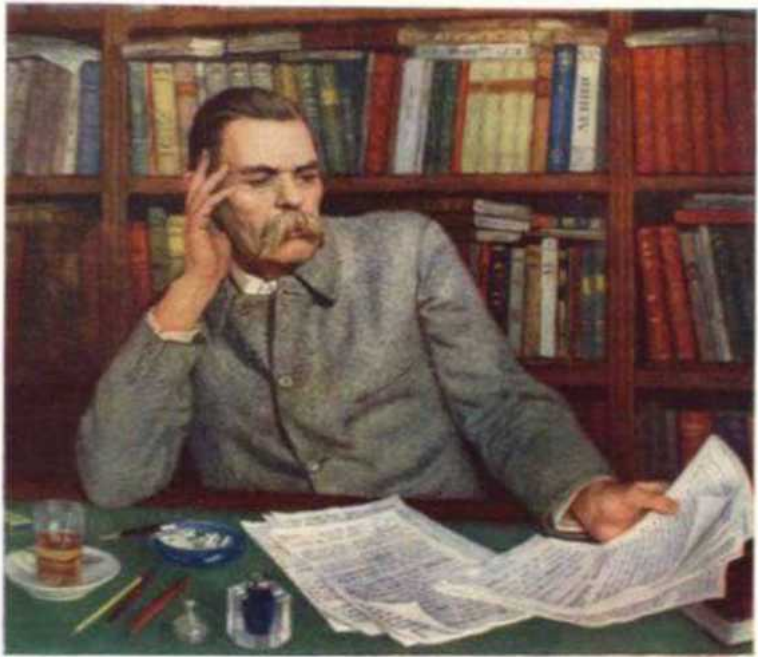
Портрет А.М. Горького

В архиве писателя хранятся фотографии, где рядом с Горьким всегда находится его секретарь (в России, Германии, Чехии, Италии). Внешность Крючкова была неброской: лысоватый блондин в пенсне, небольшого роста, крепкий.