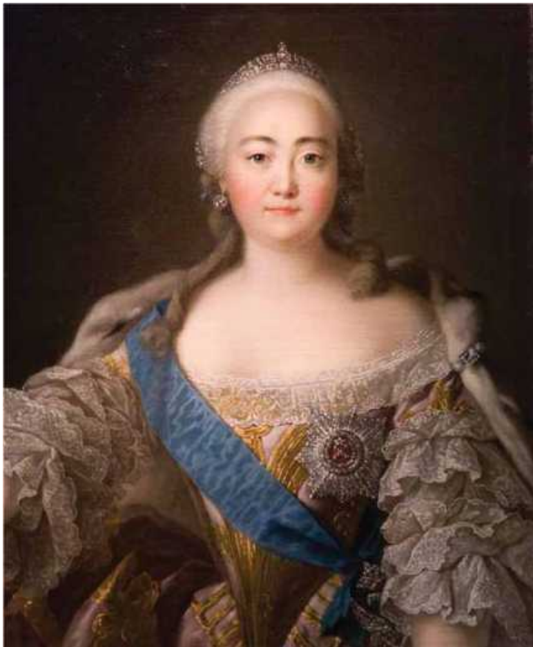
Портрет императрицы Елизаветы Петровны

Преобразования Петра I привели к четкой регламентации