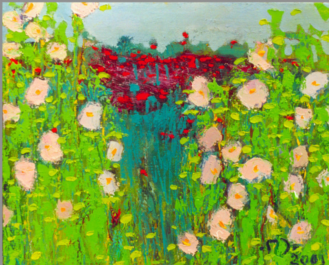
«Дикие мальвы» 2001г. 60x70 х/м