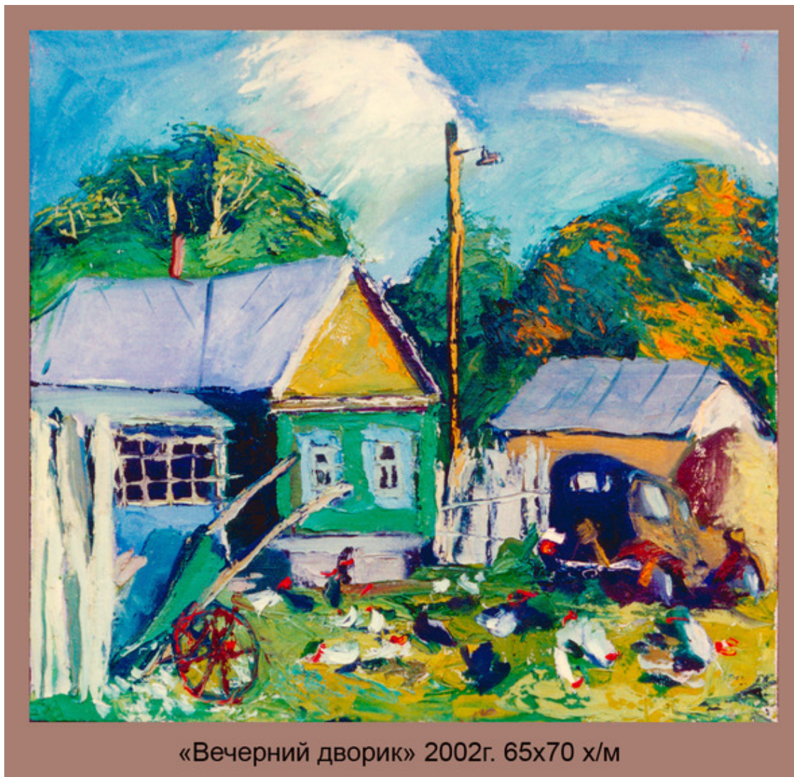
«Вечерний дворик» 2002г. 65x70 х/м

и только желание выйти, наконец, на дорогу, которая приведёт в село, подсказывает ему, что выведет его с горы один лишь способ, о котором старые люди рассказывают молодым шёпотом: нужно раздеться до гола, вывернуть всю одежду наизнанку и так и одеть её. Но это поможет тебе только выйти из леса к селу, а вот дорогу к пещере ты потеряешь навсегда.