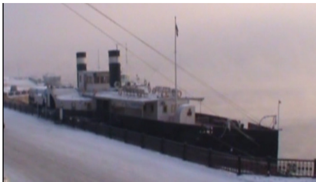
Пароход «Святитель Николай». На нем побывал наследник престола будущий император России Николай II. Затем на нем добирался в шушенскую ссылку В.И.Ленин

Образно выражаясь Сталин принял державу с сохой и сдал ее с ядерной бомбой. Руководил страной и войсками во время Отечественной войны. На его совести репрессии и Гулаг.