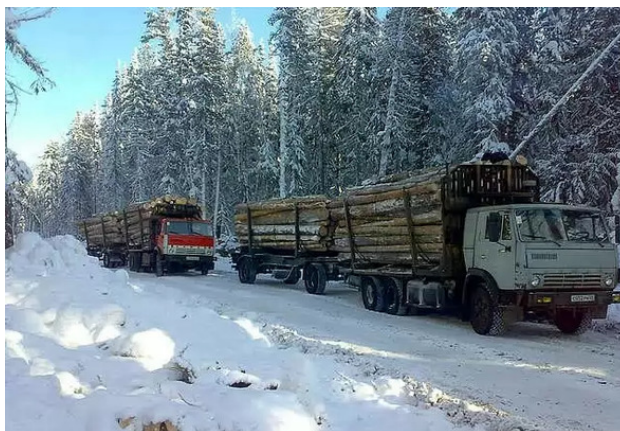
Лесовозы на вывозке леса

а потом и вообще сбежал. Вызвали меня на верх и сказали: «Скоро приедет московская комиссия, делай, что хочешь, но чтобы цех работал!». Это меня несколько не напугало. Я засучил рукава и через 3 месяца уже начал выпускать продукцию.