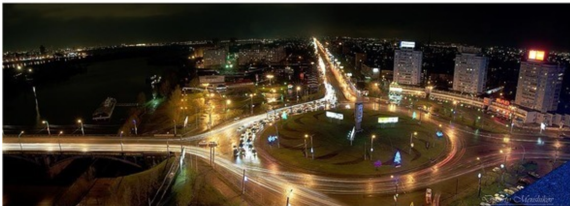
Красноярск. Предмостная площадь вечером