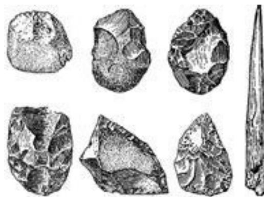
Прорисовки простейших орудий

Мать любого этапа в построении цивилизации – нужда и бедствия.