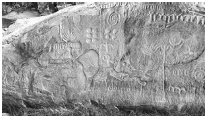
Камень Инга, Бразилия

Самым древним достоверным признакам земледелия меньше 20 тысяч лет. Первые изображения лошадей с уздой на морде – 25 тысяч лет. Разумное существо, человек, 99,5 % своей истории прожил без всякой цивилизации.