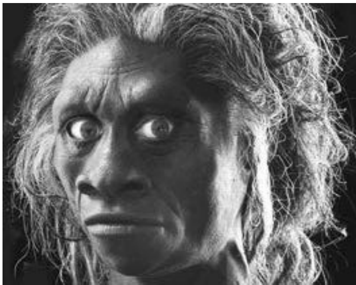
Хоббит с острова Флорес

Существует даже теория, будто разумными могут быть только существа «среднего размера»: не легче 30, не тяжелее 200 килограммов. «Если меньше – крыса, тяжелее – корова», выражаясь словами палеонтолога Н. Каландадзе. Правда, на острове Флорес найдена карликовая форма людей, которых уже окрестили хоббитами. Рост – около метра, вес – порядка 20–30 килограммов. Вместе с костями хоббитов находят каменные орудия, кострища – это никак не крысы!