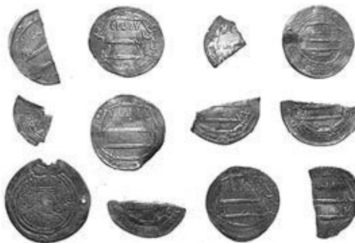
Монеты Древней Руси

Религия? Десятилетиями спорят о том, храмы ли найдены в том или другом поселении, или это дома собраний? Или «мужские дома». Что означают изображенные на стенах этих зданий леопарды и шкуры леопардов: объекты поклонения, языческие боги – или это отражения мужской доблести, своего рода символические портреты героев?