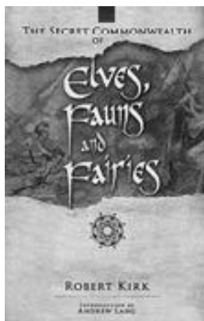
Роберт Кирк. Обложка книги «Тайный союз эльфов, фавнов и фей»

Его книга впервые была напечатана только в 1815 году (после чего переиздавалась в 1893 и 1933 годах). Но в существование эльфов верил не один Кирк. Он внезапно скончался в возрасте 48 лет – был найден возле Кургана Эльфов в Аберфойле... скорее всего инфаркт. И тут же возникла легенда, будто священника похитили эльфы, и он теперь будет жить у них, в их царстве. Конечно же, говорили и о том, что эльфы убили «слишком много знавшего» Роберта Кирка.