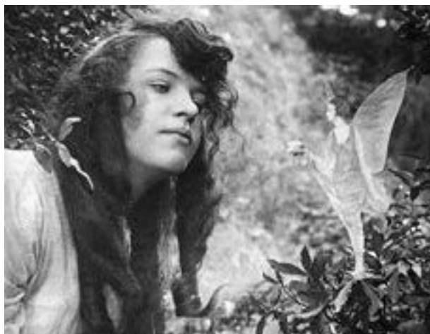
Знаменитая фотография феи

По материалам снимков и сообщений девочек, сэр Артур Конан Дойл в 1922 году написал книгу « The Coming of the Fairies » («Появление фей»). Конечно, написание книги само по себе ничего не доказывает – тем более, что сэр Артур прославился и тем, что верил в спиритизм – в столоверчение, явление духов, медиумов, борющихся с опасными привидениями... об этом он тоже писал. Книгу я упомянул, чтобы показать резонанс от сообщения девочек. После статей и книги сэра Артура читатели прислали больше 300 сообщений о встречах с феями, в том числе больше 100 фотографий. Некоторые фотографии – явная фальшивка, но другие ставят в большое затруднение экспертов. Вроде подлинные они... а феи на них видны.