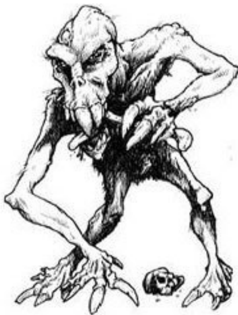
Джинны в представлении арабов

Это очень древнее слово... Пути предков европейцев и азиатских ариев разошлись 5–6 тысяч лет назад, а в древнеперсидском языке есть слово «парика», на современном фарси – пери . Это и правда персидский вариант фей.