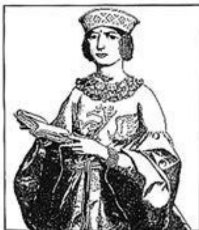
Фея Моргана в книжной графике

Гальфрид Монмутский (около 1100–1155) ввел в литературу цикл валлийских легенд о короле Артуре, его предках и соратниках, о волшебнике и мудреце Миррдине, которого он назвал Мерлином. В этих легендах действует и фея Моргана – единоутробная сестра и одновременно любовница короля Артура. В некоторых версиях легенды она – мама сына Артура, Мордреда, который в конце концов наносит отцу смертельную рану (в кельтских сказаниях Медраут назван племянником короля Артура).