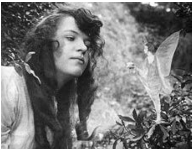
Знаменитая фотография феи