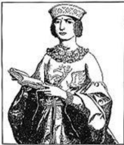
Фея Моргана в книжной графике

Гальфрид Монмутский (около 1100–1155) ввел в литературу цикл валлийских легенд о короле Артуре, его предках и соратниках, о волшебнике и мудреце Миррдине, которого он назвал Мерлином. В этих легендах действует и фея Моргана – единоутробная сестра и одновременно любовница короля Артура. В некоторых версиях легенды она – мама сына Артура, Мордреда, который в конце концов наносит отцу смертельную рану (в кельтских сказаниях Медраут назван