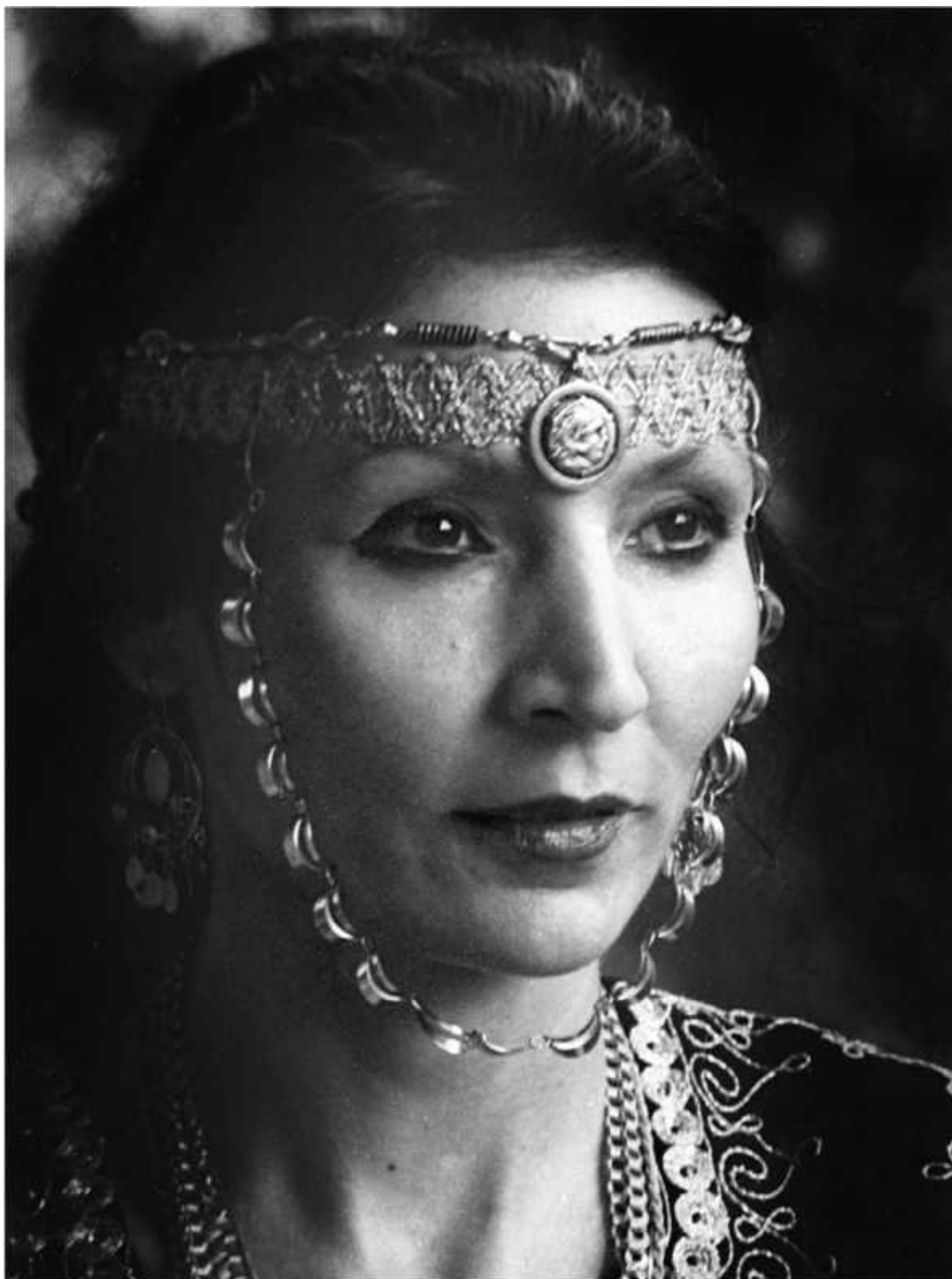
На съемках фильма «Юность гения» в роли целительницы Юны

Режиссер прервал съемки. Наступила тягостная тишина. Джуна забыла о кино, что пришла на съемочную площадку в нарядном платье времен Авиценны, и начала делать то, что всегда: пассы, массаж. Так прошло полчаса. Присутствующие устали от нервного напряжения. Режиссер первый не выдержал и вышел со съемочной площадки покурить. Вернулся и застал такую картину. Все застыли на местах, и в царившей тишине было слышно, как Джуна и старик разговаривают. Режиссер пожалел, что не снял эту сцену. Старик упал на колени, начал молиться, благодарить Джуноу, обещая зарезать в ее честь барана. Этот случай – яркий пример