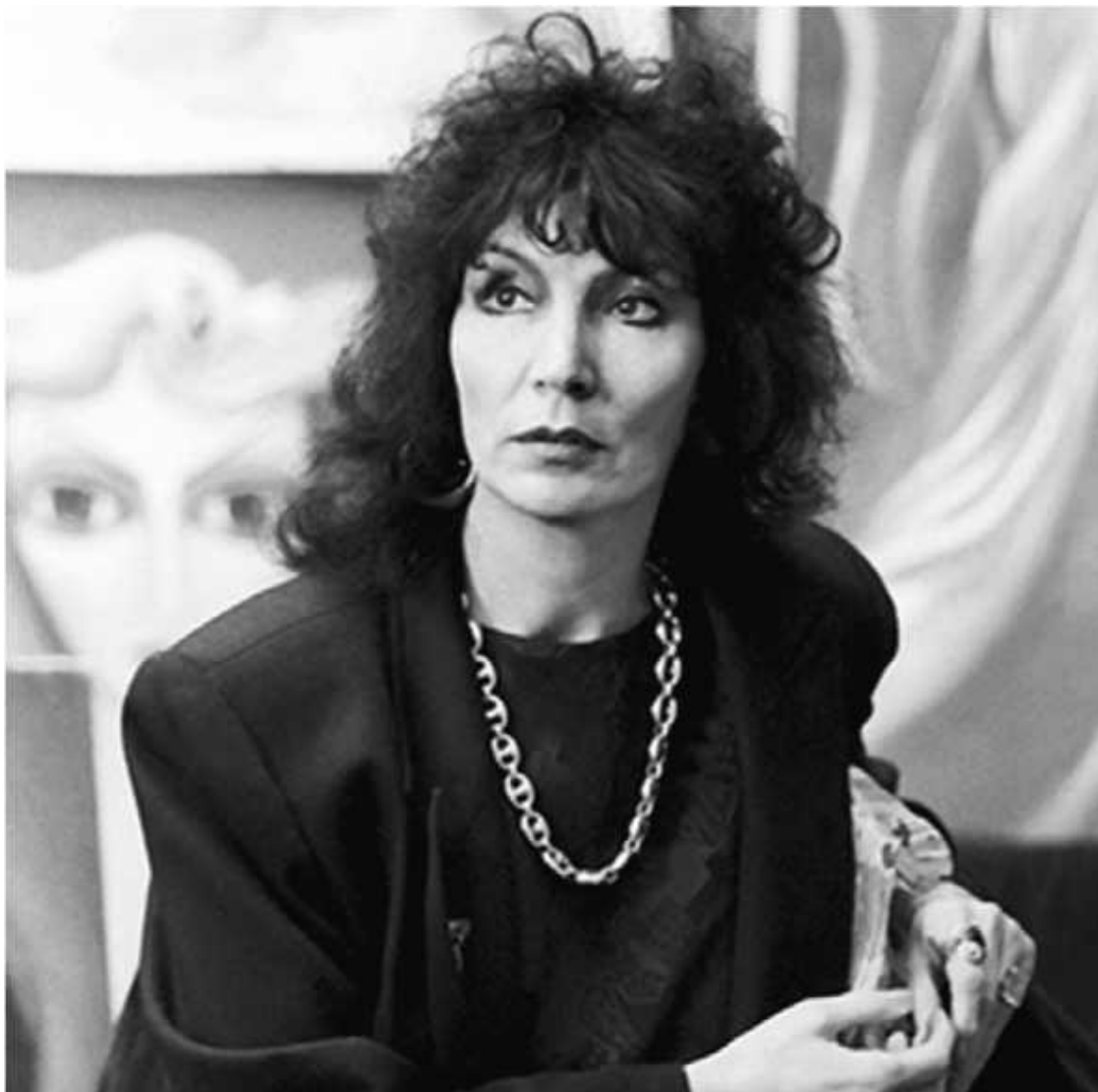
Евгения Давиташвили, прославившаяся в XX веке под псевдонимом Джуна

не решились испытать загадочный телекинез Нинель Кулагиной – «феномен «К»», также изученный в лаборатории ИРЭ АН СССР.