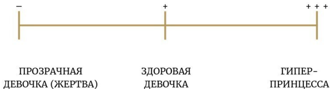
Рис. 4. Полюсы проявлений Вечной Девочки

Рассмотрим три полюса проявлений Вечной Девочки (рис. 4).