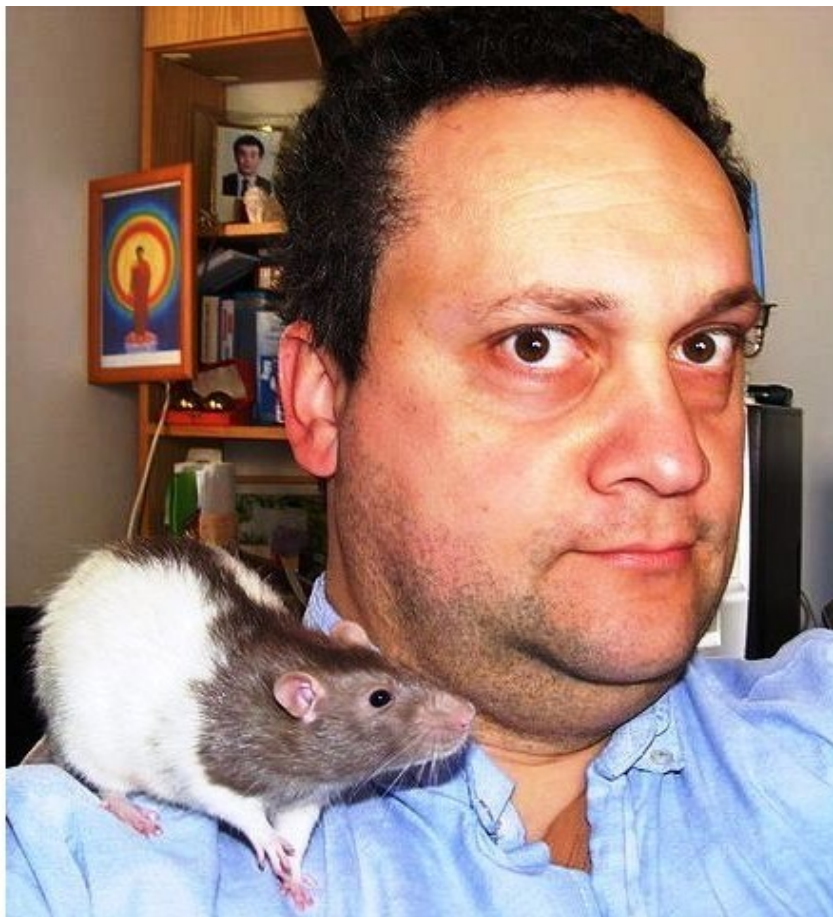
Я и крыс Сосо.

Создано в интеллектуальной издательской системе Ridero