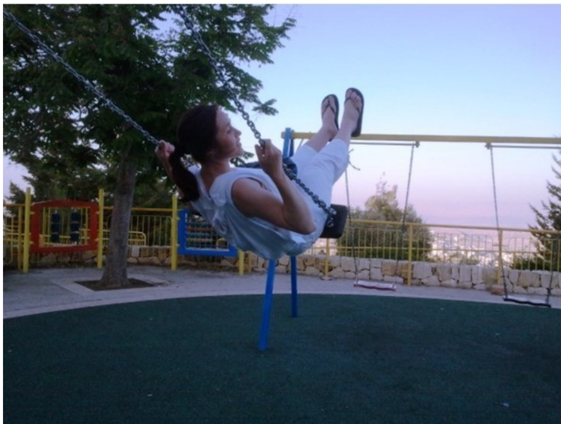
Это Ласточка в свободном полёте...