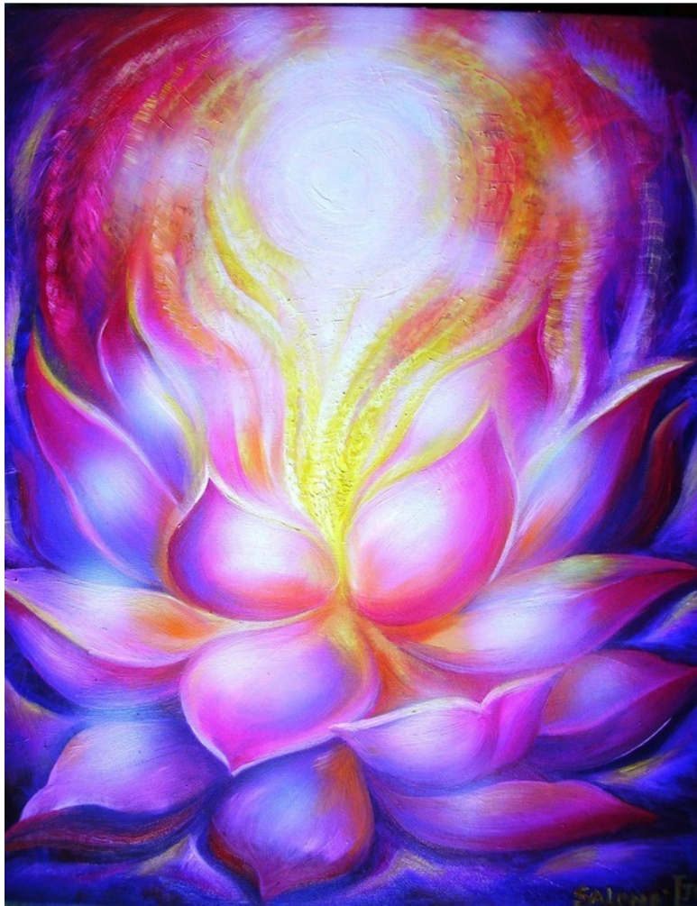
Картина кисти художника Юлии Лагус