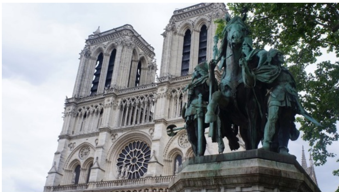
Парижский собор Нотр-Дам.