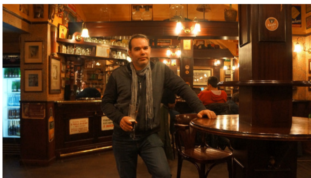
Бар «Толстая Коала», Прага.

Они быстро засеменили в сторону, типа не со мной, так как, видимо, мой крик их ошарашил. А я с песнями «Ой мороз, мороз» и «Ворон» добрал до «Коалы», выпил «Вельвета» и пошел в отель. Потом на следующий день переваривал то, что со мной произошло, и представлял, как бы могла судьба распорядиться, если бы все пошло по другому сценарию. Но скажу одно – я ни капли не жалею об этом приключении, которое мне подарила судьба! Я ощутил все чувства, которые даны человеку, чтобы он наслаждался жизнью и сравнивал!