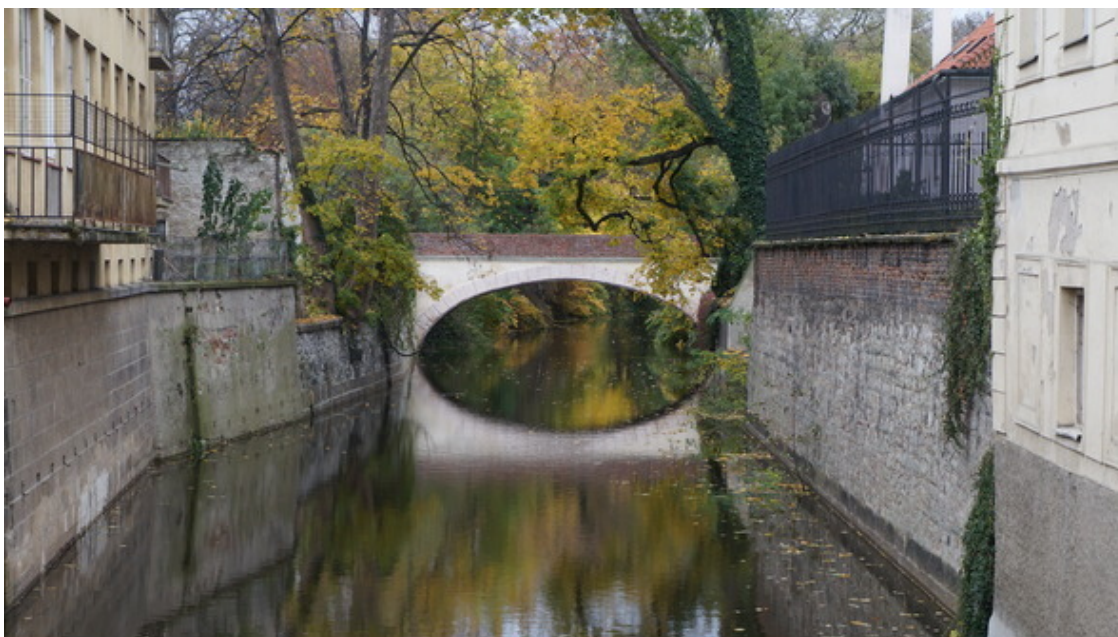
Остров Кампа, река Чертовка, Прага.

Ну вот, пришло время для очередной поездки в Прагу! И не просто поездки, а как всегда – приключения! Ох, люблю я это слово!!! А вы вообще задумывались, откуда берутся приключения? Лично я без них жизни себе не представляю, это движение, это адреналин, это чувства, эмоции, все не перечислить, да вы и сами можете это ощутить, если вспомните свои приключения.