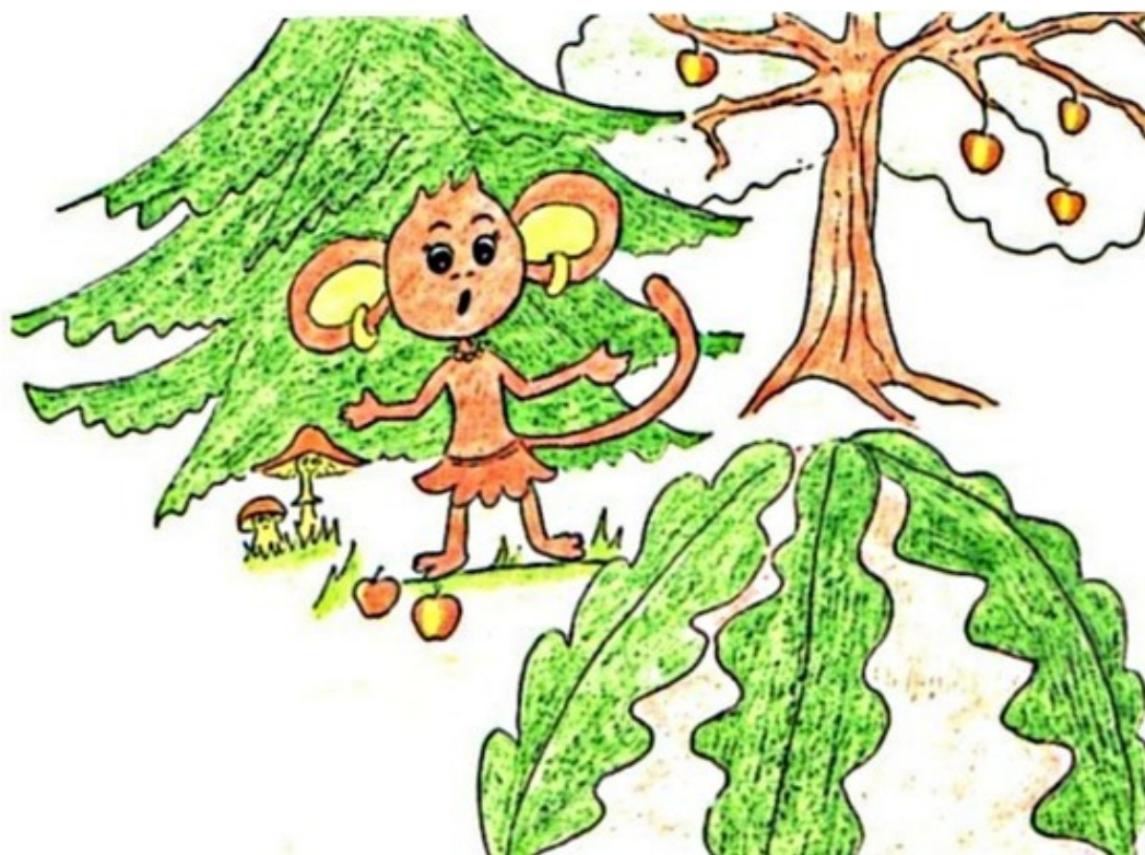
Обезьянка находит таинственную дверь. Рис. А. Дубровиной

– Это чтой-то там? – пробормотала она, заведя среди кустов, окружавших Поляну, неизвестно откуда взявшийся холм, покрытый огромными листьями незнакомого дерева. – Это как это? – почесала затылок Обезьянка и тяжело поднялась с земли.