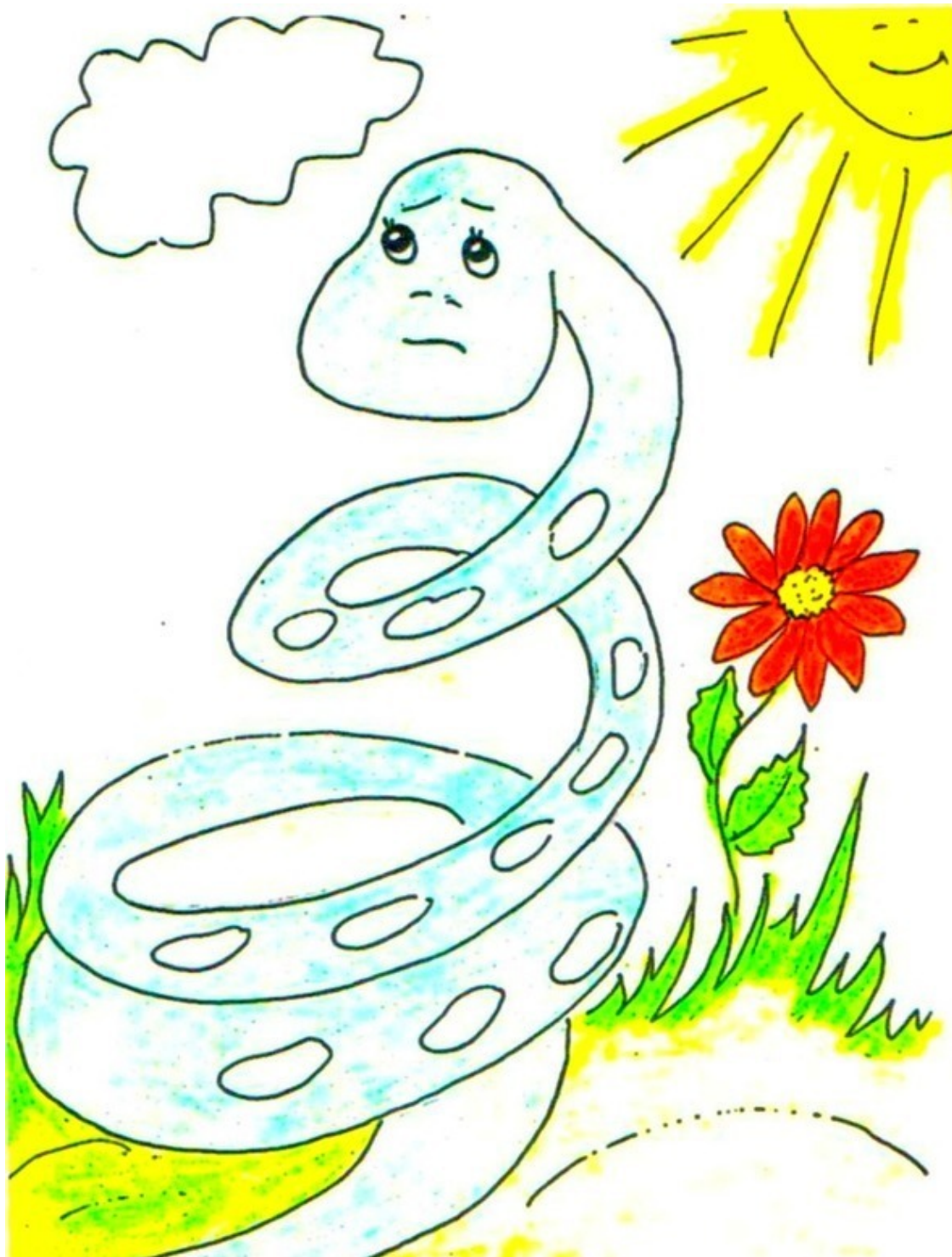
Питон Уно. Рис. А. Дубровиной

– Выходит, Обезьянка, действительно, не так проста? – мучительные сомнения в собственной правоте скреблись у него в душе. Но, надо отдать должное Уно, он постарался искренне взглянуть на Обезьянку новыми глазами.