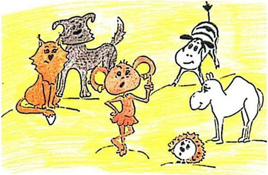
«Звёзный час» Обезьянки. Рис. А. Дубровиной

– Сотрудничать? А что это такое? – неожиданные вопросы посыпались со всех сторон. Обезьянка, обрадованная всеобщим вниманием, продолжала: