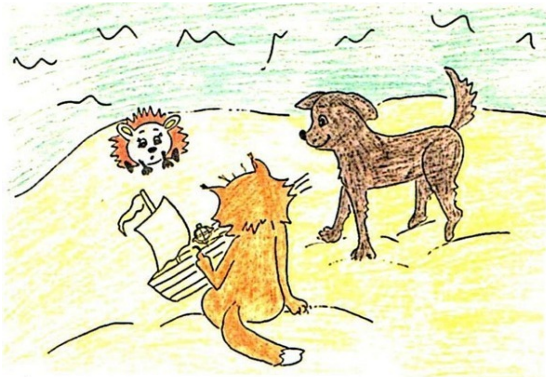
Мурка рисует корабль. Рис. А. Дубровиной

– Здорово! – обрадовался Пёс Бак. – Будешь подъемным краном! – засмеялся он. Мурка в это время чертила на песке своим острым коготком.