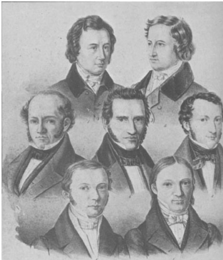
Карл Роде. Геттингенская семерка, в верхнем ряду: Вильгельм и Якоб Гримм