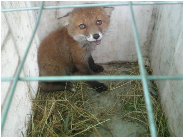
Лисёнок у нас на даче

К нам забрёл во двор лисёнок, видно, маму потерял.