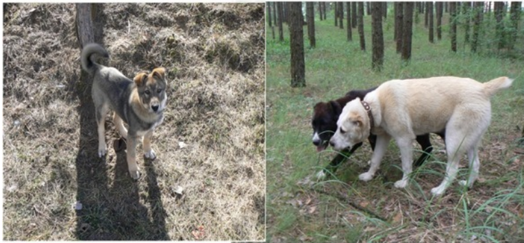
Наши собаки

Папа любит всех собак, Мама любит кошек. У нас дома зоопарк И на даче тоже.