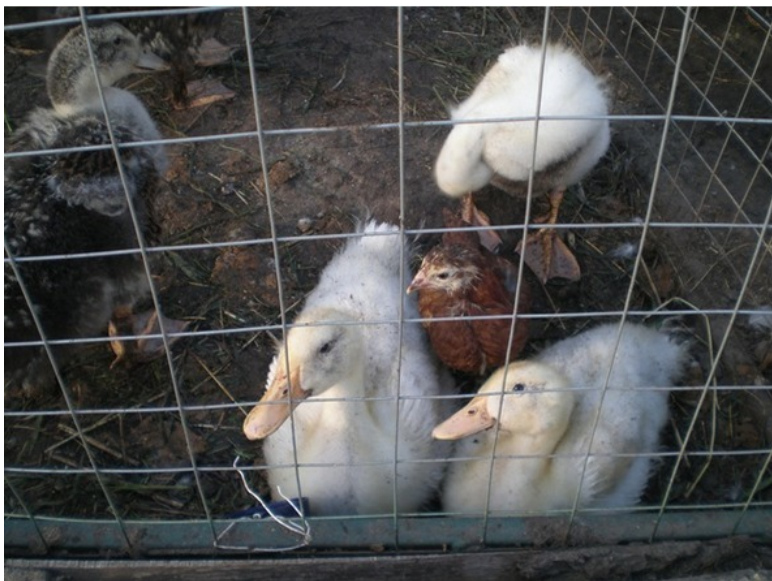
Петушок с утятами

Наш цыплёнок Тива-Тив Долго рос с утятами, Он один остался жив В странном инкубаторе.