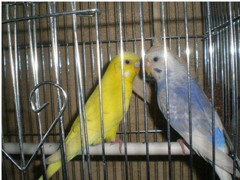
Наши попугаи Кеша и Риточка

Кеша попугайчик- ласковый наш мальчик! Целый день целуется, с Риточкой милуется. Ей поёт протяжно, сообщает важно,