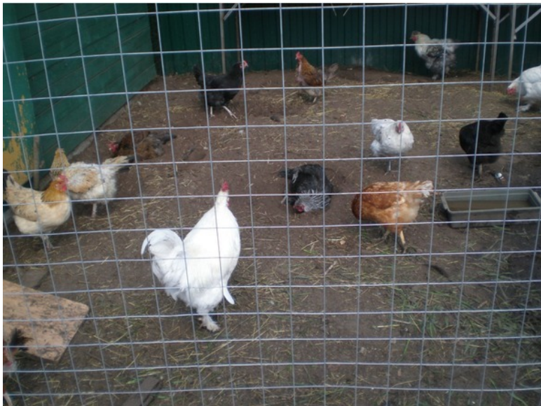
Петушок с курочками

Заболел наш Петушок, У него сел голосок, По утрам, когда поёт, Хрип какой-то издаёт.