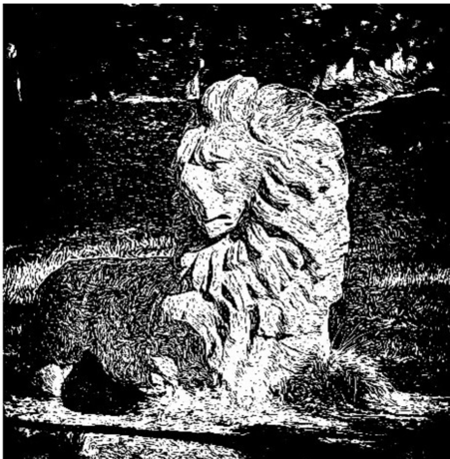
Остатки «Независимости Финляндии».

В 1940 году «независимого» льва постигла та же участь, а Пётр Первый возвращён на своё место. Когда уже немцы в 1941 году опять скинули русского царя, несчастного покалеченного льва уже не стали восстанавливать, а отправили в «Монрепо».