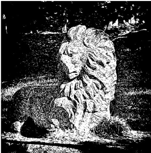
Остатки «Независимости Финляндии».

С тех пор десятки неприкаянных духов, обитающих в этой скульптуре, заражают своей «русофобской энергией» всех желающих посидеть на льве или просто сфотографироваться рядом с ним. Размещая в соцсетях или пересылая такие фото своим знакомым, финские туристы не понимают, что увеличивают количество зла и ненависти в отношениях с нашими соседями.