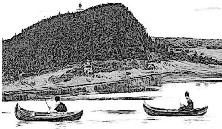
Соловки (М.Нестеров, "Молчание")

На самом деле древние шаманы сложили сотни этих каменных пирамидок над пересечениями энергетических линий, названных в прошлом веке сеткой Хартмана.