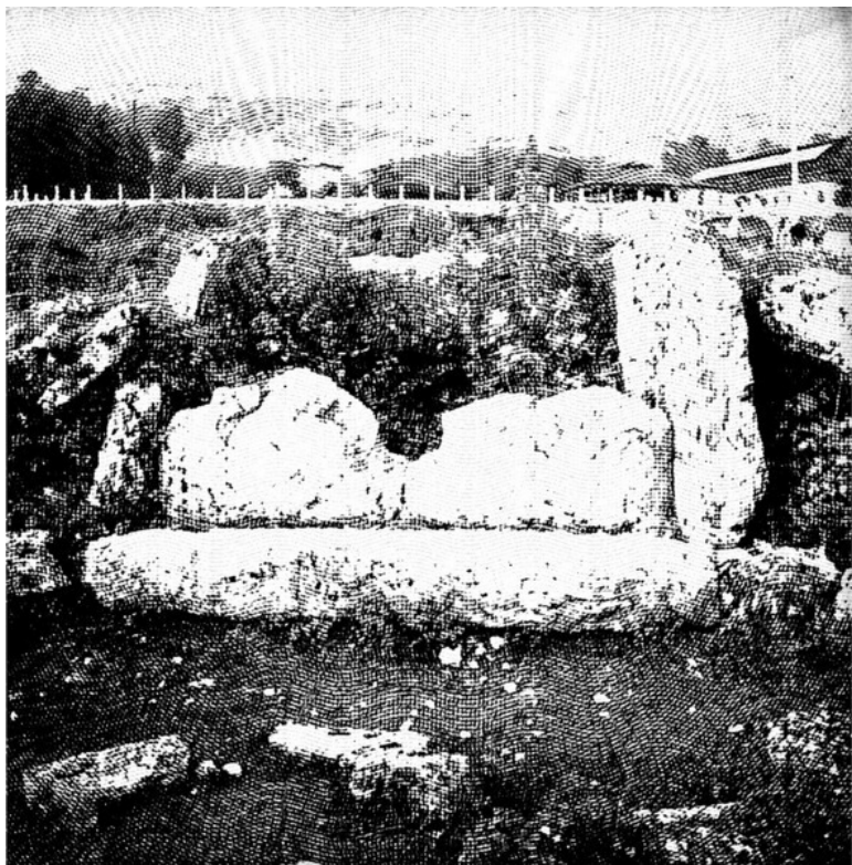
Дольмен в Отхаре.

Сколько бы мегалитических комплексов я ни обследовал – все они возводились с утилитарными, связанными