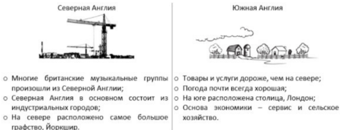
Рисунок 3 - Северная и Южная Англия

Задание: составьте конспект полученной в главе информации.