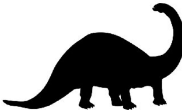
Рисунок 4 - Лох-Несское чудовище

Лох-Несское чудовище На территории Шотландии находится знаменитое озеро Лох-Несс. Его максимальная глубина – 226 метров. Это озеро известно во всем мире благодаря легенде о Лох-Несском чудовище. Первыми о таинственном существе заговорили римские legionеры. Чудовище упоминается в письменных источниках, восходящих к 565 году нашей эры. В 1933 году британская газета опубликовала историю супругов, которые столкнулись с Несси. Они рассказали, что видели, как на поверхности воды в озере появились несколько горбов, которые то всплывали на поверхность, то снова тонули. Они двигались волнообразно, как змея, но были очень большими. Сторонники существования чудовища считают его дожившим до наших времен видом динозавров, но за 70 лет наблюдений не удалось найти никаких останков этих животных.