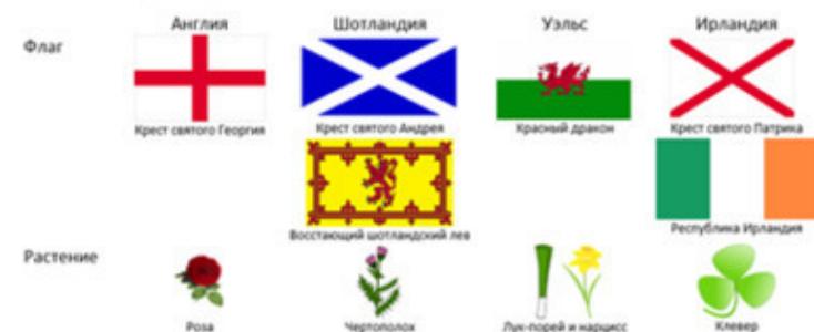
Рисунок 2 - Символы четырёх наций