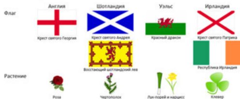
Рисунок 2 - Символы четырёх наций