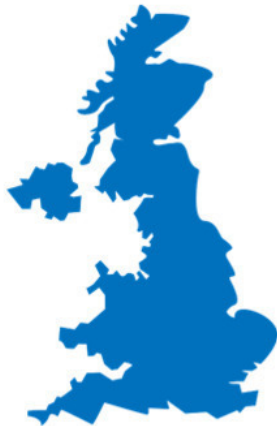
Рисунок 1 - Британские острова

Флагом Великобритании является «Юнион Джек» или «Союзный гюйдс» («Union Jack»). За время своего существования этот флаг несколько раз изменялся. Современный Британский флаг – это красный прямой крест в белой окантовке на синем полотне, а под ним расположены белый и красный косые кресты. Второе официальное наименование