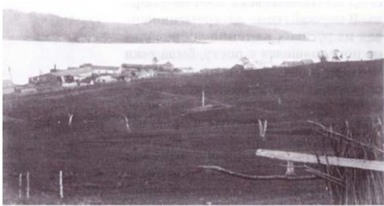
Механическая мастерская в порту Владивостока.

Вестовой остался ждать, а Коля отправился с распоряжением к мастеру. Мастер был малограмотным, но успешно скрывал это от мальчишек, которые были у него в подчинении. Он был профессионалом своего дела, и всем окружающим было все равно, может ли он сложить несколько букв в слово, чтобы прочесть утреннюю газету. Впрочем, нельзя сказать, что мастер, Петр Николаевич, вообще не знал алфавит. Буквы он знал, но складывать их в слова было сущим мучением для пожилого человека.