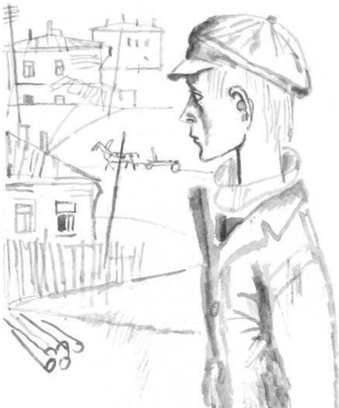
Рисунки В. Гальдяева