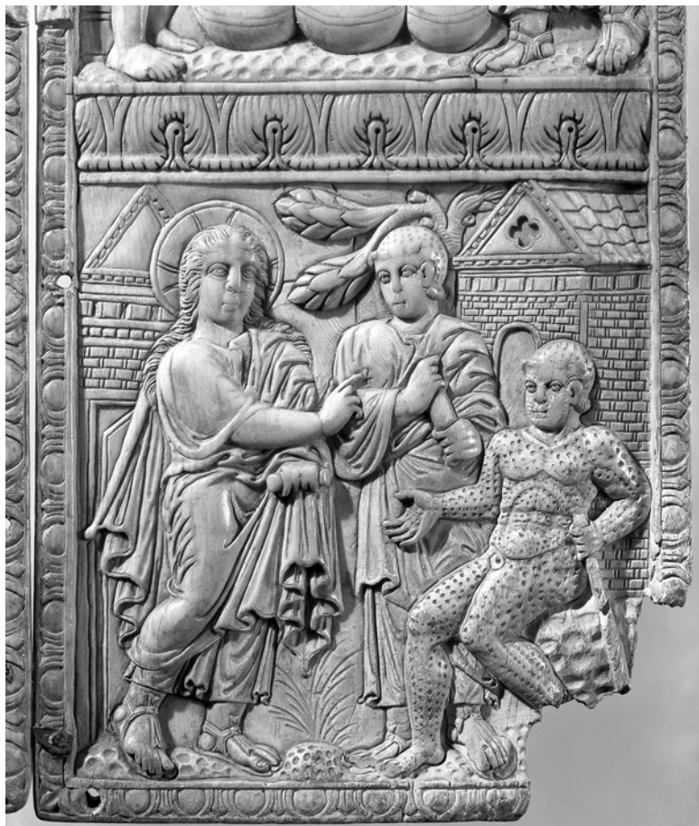
Илл. 17. Чудеса исцеления. Средний человек видел в Христе чудотворца. Даже язычники чтили его как могущего