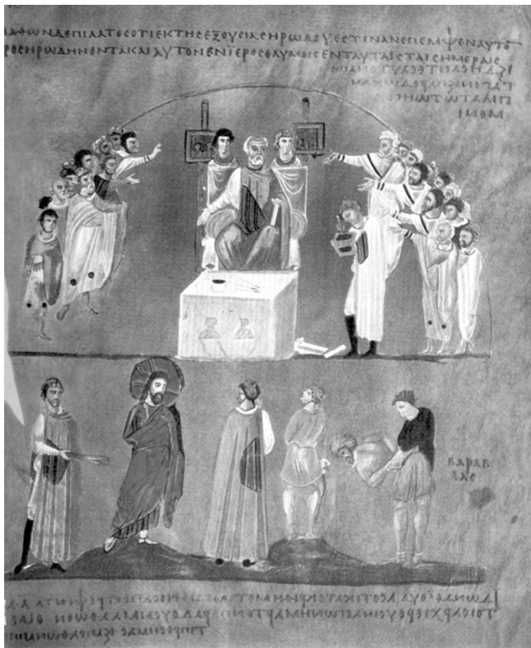
Илл. 14. В позднеримский период в претории образы императора висят рядом с возвышением, на котором располагается кресло правителя, и толпа приветствует их, когда