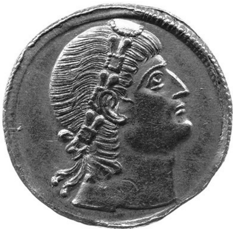
Илл. 5. «Средневековый доллар»: золотой solidus Констан-

из той же среды. Сыновья торговца свининой, или нотариуса небольшого города, или гардеробщика в публичных банях становились префектами претория, от которых при Константине и Констанции II зависели благополучие и стабильность восточной части империи.