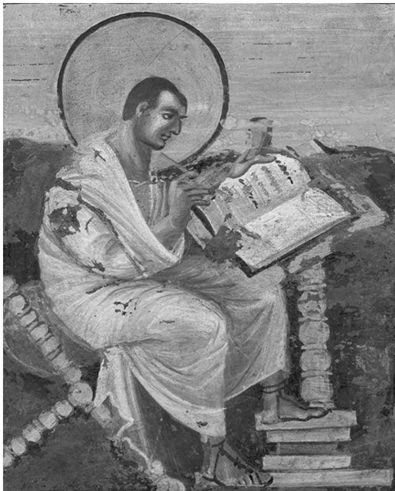
Илл. 9. От человека культуры к евангелисту. Апостол Матфей из имперского Евангелия, Ахен, до 800 года н. э. Му-