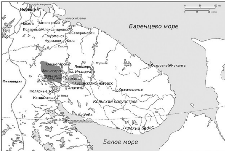
Карта 1. Кольский полуостров.

Землей, которая вызвала у Энгельгардта такие предчувствия, был Кольский полуостров. За исключением небольшого кусочка Терского берега почти вся мозаика его экосистем тундры и тайги расположилась за Северным полярным кругом. Во внутренней части полуострова над низинами возвышаются небольшие горные хребты – Хибинские горы и массивы Ловозера и Монче-тундры. Ландшафт усеян многочисленными пресными озерами, включая внушительное по размеру озеро Имандра, и многочисленные реки, такие как Нива, Тулома, Поной, Иоканга и Варзуга, пересекают его. Хвойные леса, которые редуют с увеличением вы-