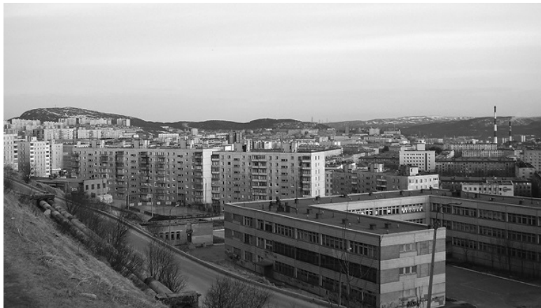
Ил. 2. Мурманск в начале XXI в.

Почему этот удаленный форпост Российской империи превратился в одну из наиболее экономически развитых и вместе с тем экологически нарушенных северных территорий XX века? Чем объяснялось стремление советского руководства отстраивать эту часть Арктики так экстенсивно? Предвидел ли это Энгельгардт, когда писал о «сокрытых в этих берегах силах», способных возродить к жизни этот край? Как именно природа Кольского полуострова влияла на советские усилия по развитию промышленности, которые, в свою очередь, изменили природу полуострова? Какие идеи об изменении природного мира и какие практики этого изменения коммунистические вожди заимствовали из опыта других стран, а какие изобрели сами? Как советский опыт