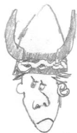
Крепкий Орешек- младший