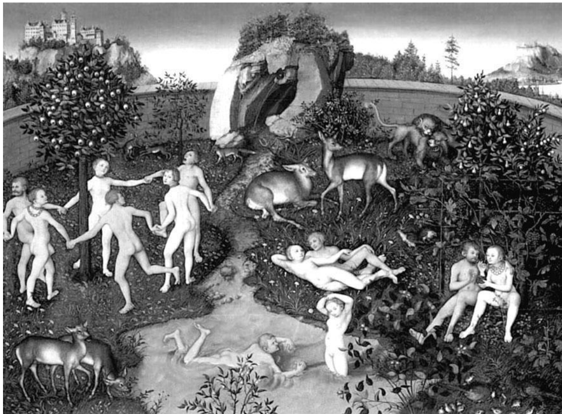
Золотой век. Лукас Кранх Старший

думал о возможных прискорбных последствиях взрыва). Или, к примеру, можно представить, что написал бы утопо-моралист, доведись ему прогнозировать будущее биосферы. Из-под его пера вышло бы заключение о кошмарной тупиковости биологической эволюции, сопровождаемое рекомендациями по устойчивому развитию динозавров и списком заповедей мирного сосуществования зайцев и волков.