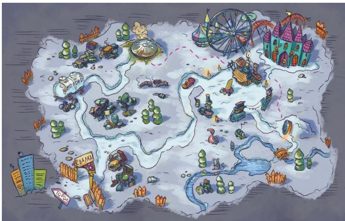
Иллюстрации Михаила Дунаковского