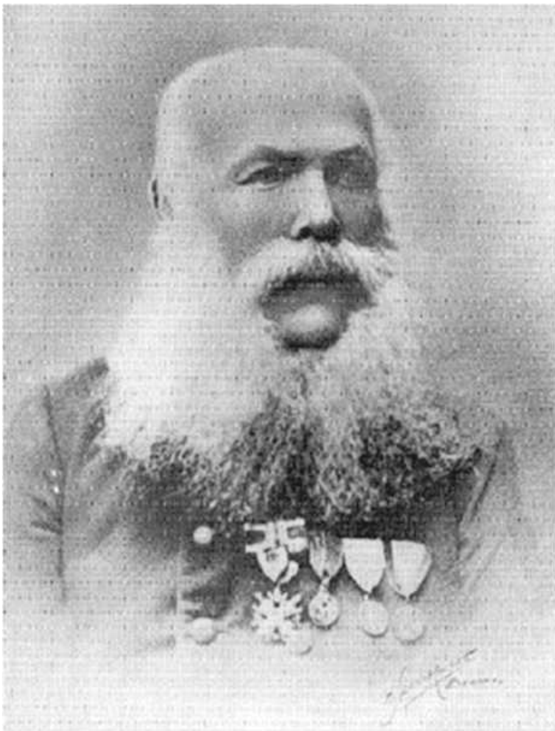
Отец Антона Деникина Иван Ефимович Деникин (1807–1885)

После этого он никогда с братом не встречался. Иван Ефимович даже представлять себе не хотел, что такое компромисс. На таком отцовском оселке правился и характер Деникина-младшего.