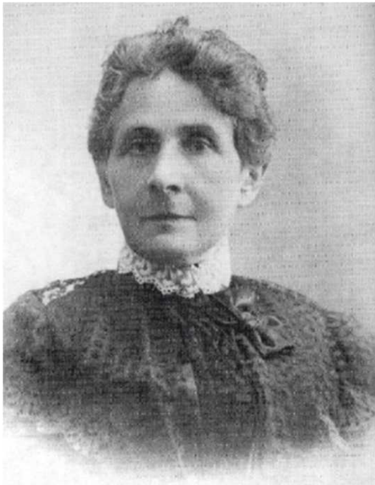
Матъ Антона Деникина Елизавета Фёдоровна (Фран-