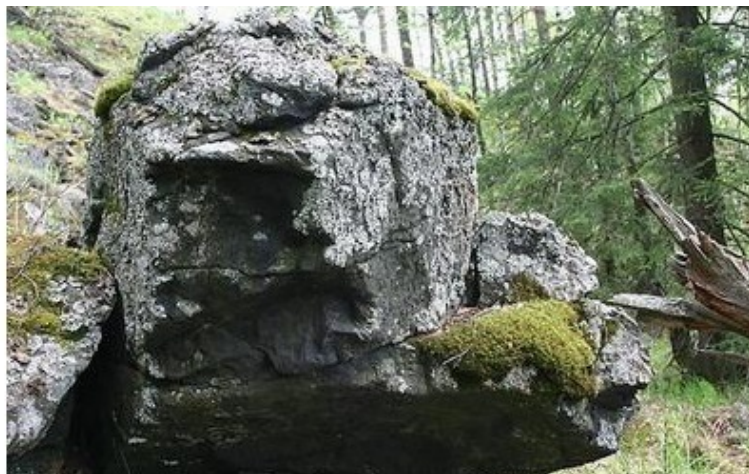
Выступы израндита на горе Карандаш

Множество фактов научных на свете Слышали взрослые, слышали дети, Так попытайтесь себя испытать: Самую древнюю гору назвать... Эта вершина на южном Урале, В мире о ней лишь недавно узнали, С виду, ни чем не приметна она, В море таёжном как остров видна.