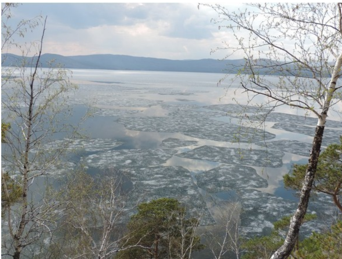
Озеро Тургояк ранней весной.

Как память о Туре и милой Гояк, В межгорной долине Урала, Есть озеро с чистой водой – Тургояк, Зовут его братом Байкала.