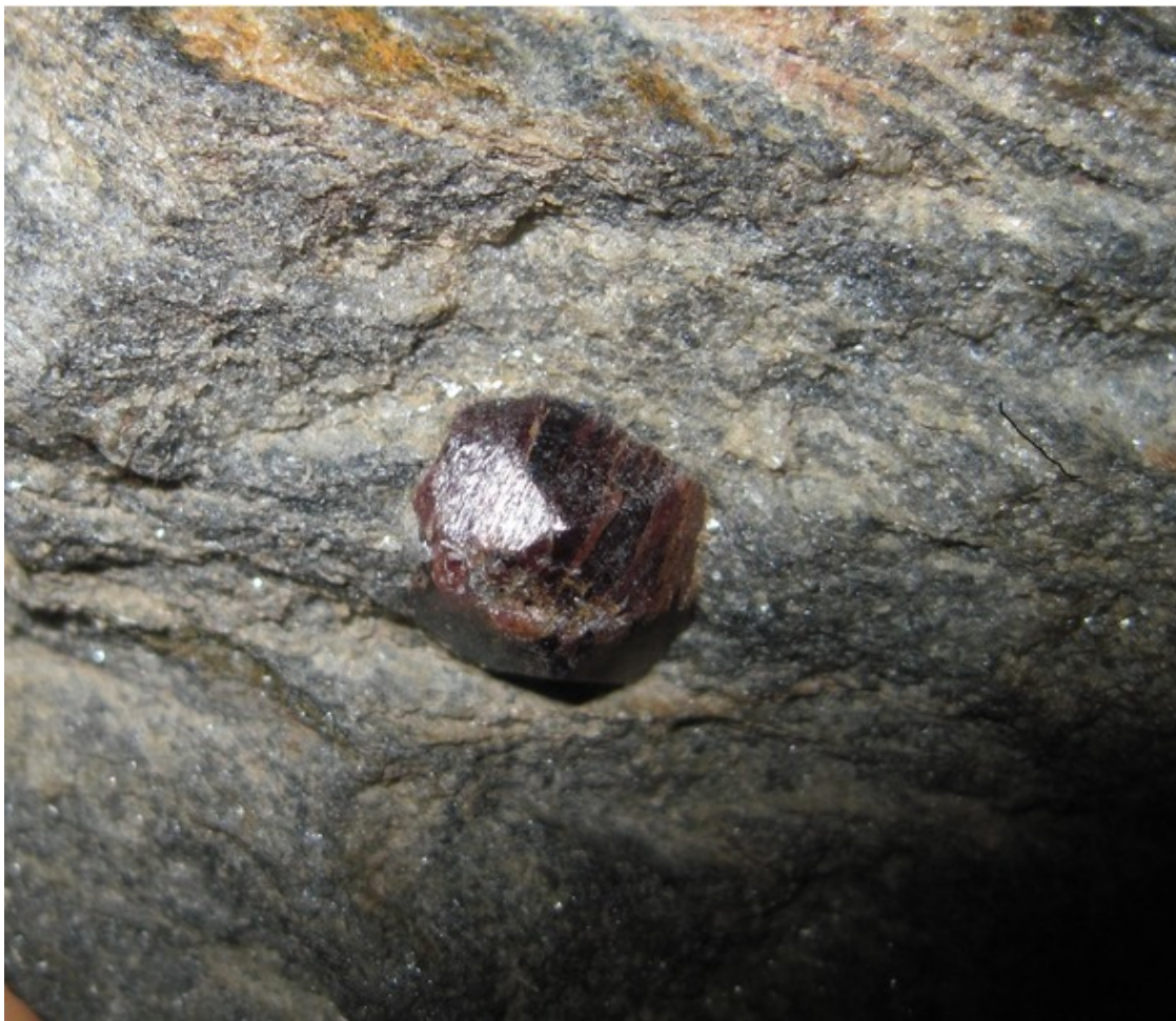
Кристаллы граната на скалах и обломках камней.

Тот, кто сумеет к вершине добраться, Скалам и ветру шальному отдаться, Сможет увидеть в бескрайней дали Всю широту Таганайской земли.