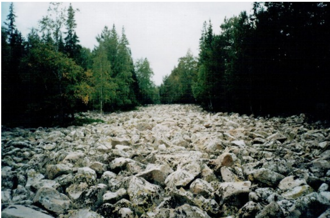
Каменная река .

Существует множество преданий о том, что когда в эти места пришли люди, проживающие здесь и поныне, их населяла чудь. Но гордый народ не захотел жить с инакомыслящими людьми и вместе с тайными знаниями и несметными сокровищами ушел под землю.