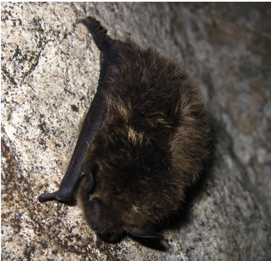
Киселёвская пещера. Летучая мышь во время зимней спячки.

За низким, широким проходом, Где двигаться надо ползком, Опять поднимаются своды, На несколько метров кругом.