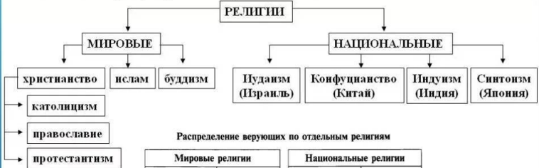
Распределение верующих по отдельным религиям

В зависимости от распространения все религии делят: